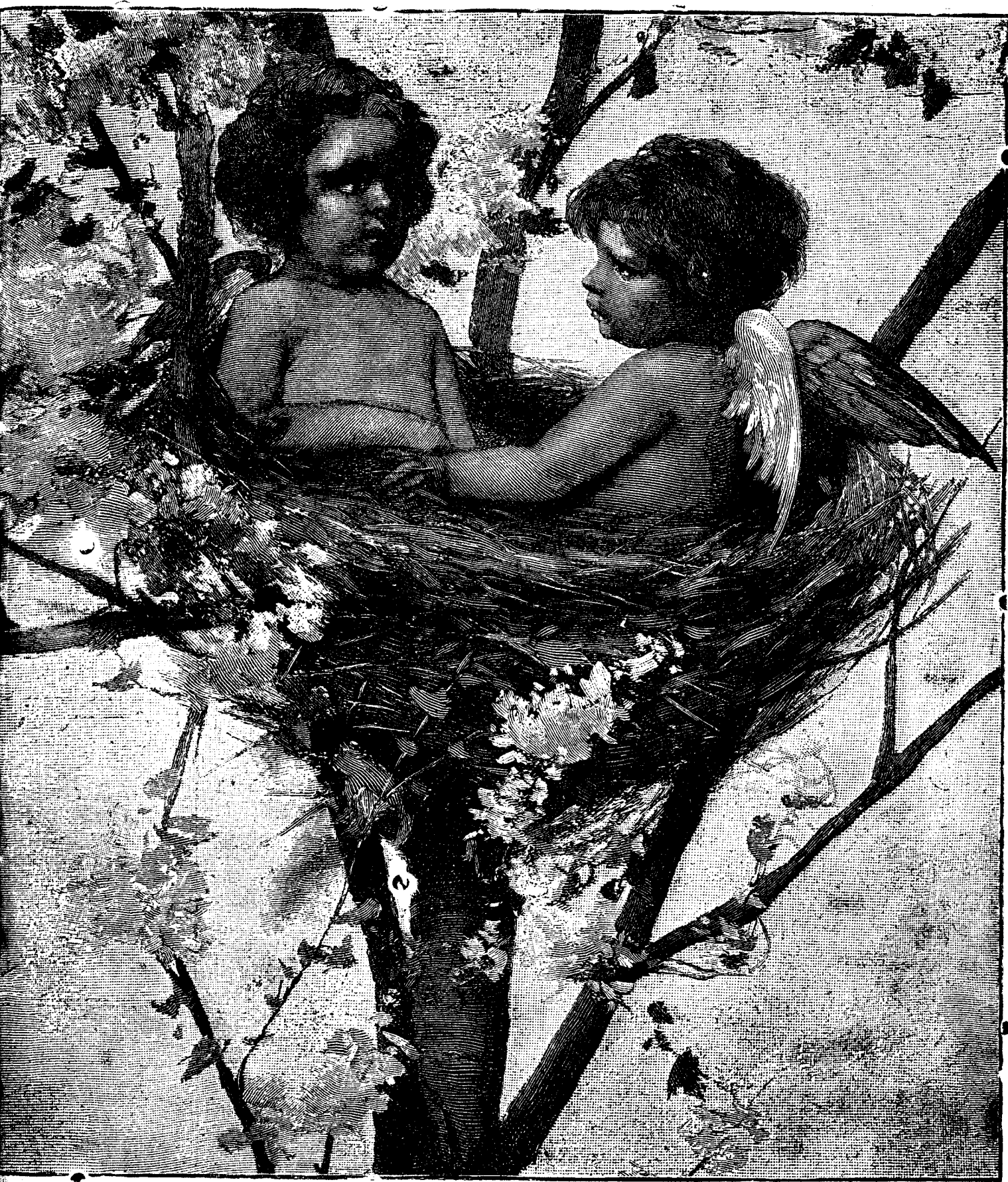
UN CUIB DRĂGĂLAȘ.