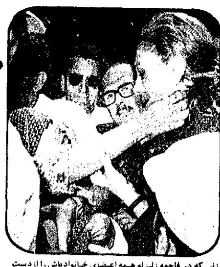
زنی که در فاجعه زلزله همه اعضای خانواده اش را از دست داده است، در حضور شهبانو می‌گریزد و از مصیبتی که بر او رفته است، سخن می‌گوید.

حکومت نظامی مطلقاً ما را به عقب بر نمیگرداند نخستوزیر در پاسخ نمایندگان سنا گفت: * اکنون وضع ما طوری است که اگر بگوئیم روز است، مردم میگویند حتماً شب است. صفحه ۲