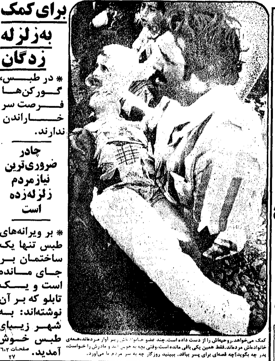
کمک می‌خواهد، روحیه اش را از دست داده است. چند عضو خانواده اش را از دست داده است. مادرش را خواست، پدر چه بگوید چه قسمی برای پسر بیاید. ببینید روزگار چه بر سر مردم ما می‌آورد.

تا غروب دیروز در طبس و چند روستای زلزله‌زده * طبس و روستاهای اطراف هنوز می‌لرزند.