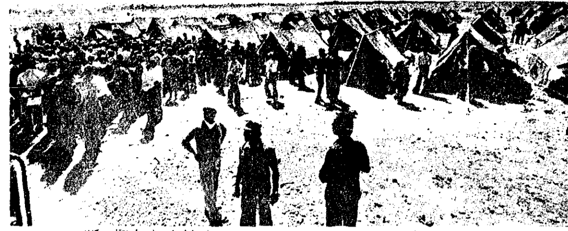
چادر برای زلزله‌زدگان از لازم‌ترین وسایل است. اکنون در نقاط زلزله‌زده محرومان زلزله را به چادرها منتقل می‌کنند.

مصدومین طبع هستند و درخواست شد عداای از بیماران به کرمان منتقل شوند و کمبته امداد بانوان نیکوکار، کرمان نیز امداد کی خود را برای پذیرش عداای از اطفال سرپرست طبع اعلام کرد. هم‌اکنون تعداد ۳۰ نخت و وسایل لازم پزشکی در این بیمارستان تدارک دیده شده تا در صورت انتقال زلزله‌زدگان طبع باصفهان مورد استفاده قرار گیرد.