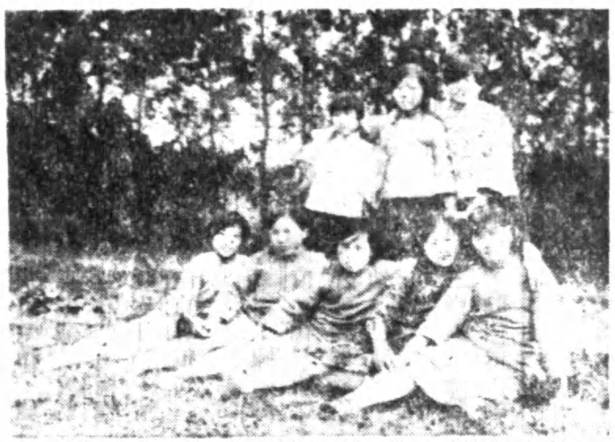
▲一羣女子師範學生

行部者，中國國民黨中央執行委員西南執行部之簡稱，事實上與中央對壘之駢枝機關也。試問中央執委，何以不在中央？而匿在西南？在西南何以又設駢枝機關，處理黨務？本