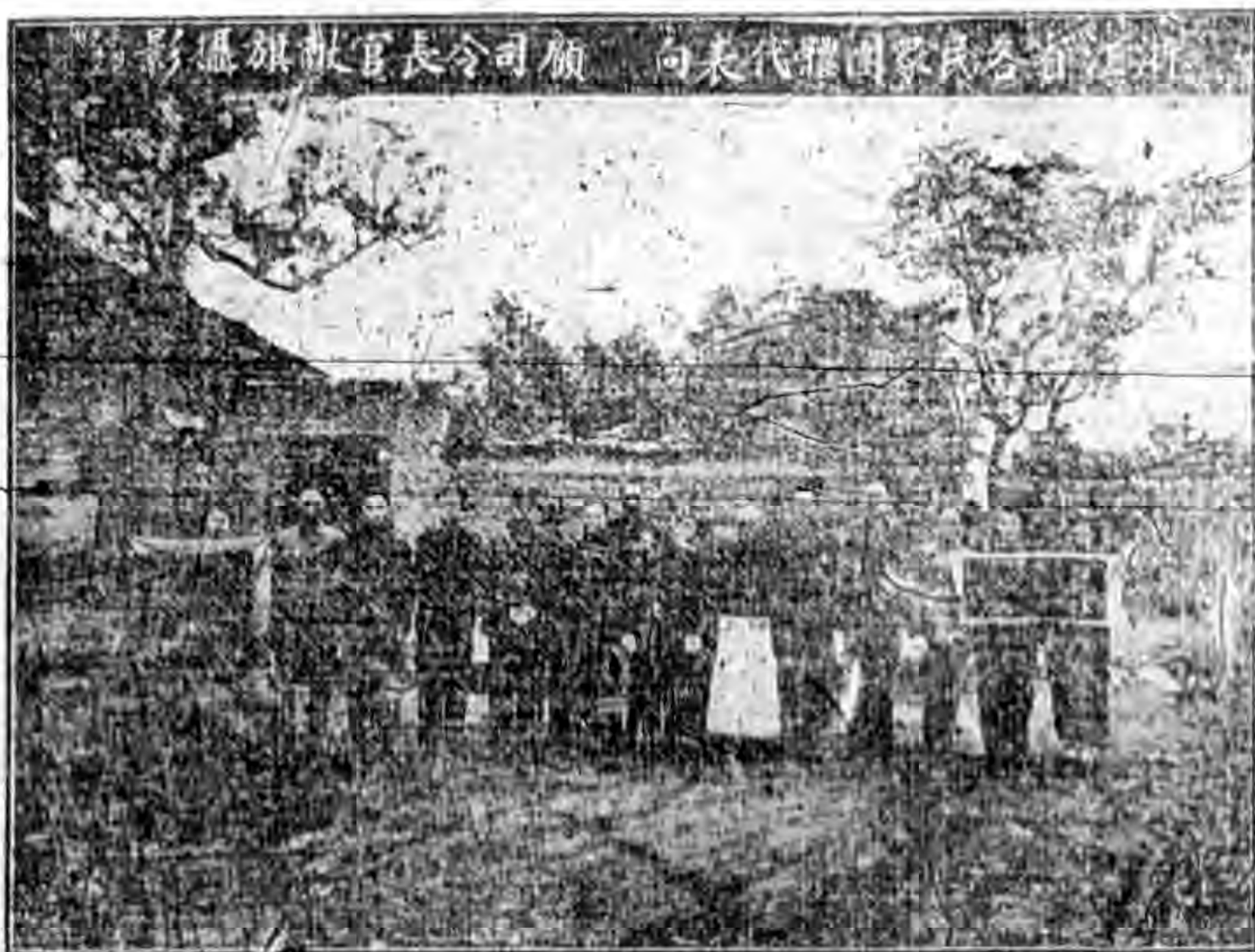
江浙各省民衆團體代表向願司令官獻旗

浙省臨時參議會第五次大會第九次會議，通過「建議中央對於改善田賦改征實物明定各項辦法」，及「改善本省常平倉穀辦法以利民食」兩案。建議計分六項，第四項為：「浙西缺糧省份，亟起稻穀，除供軍公學米外，請准悉數由本省常平倉承購，平價出糶，以維民食。」至改善本省常平倉穀辦法，則列舉五項，第五項為：「常平倉穀之主旨，首在調劑民食，故倉穀之分配，應由省糧倉局參酌出賦征收實物數量，