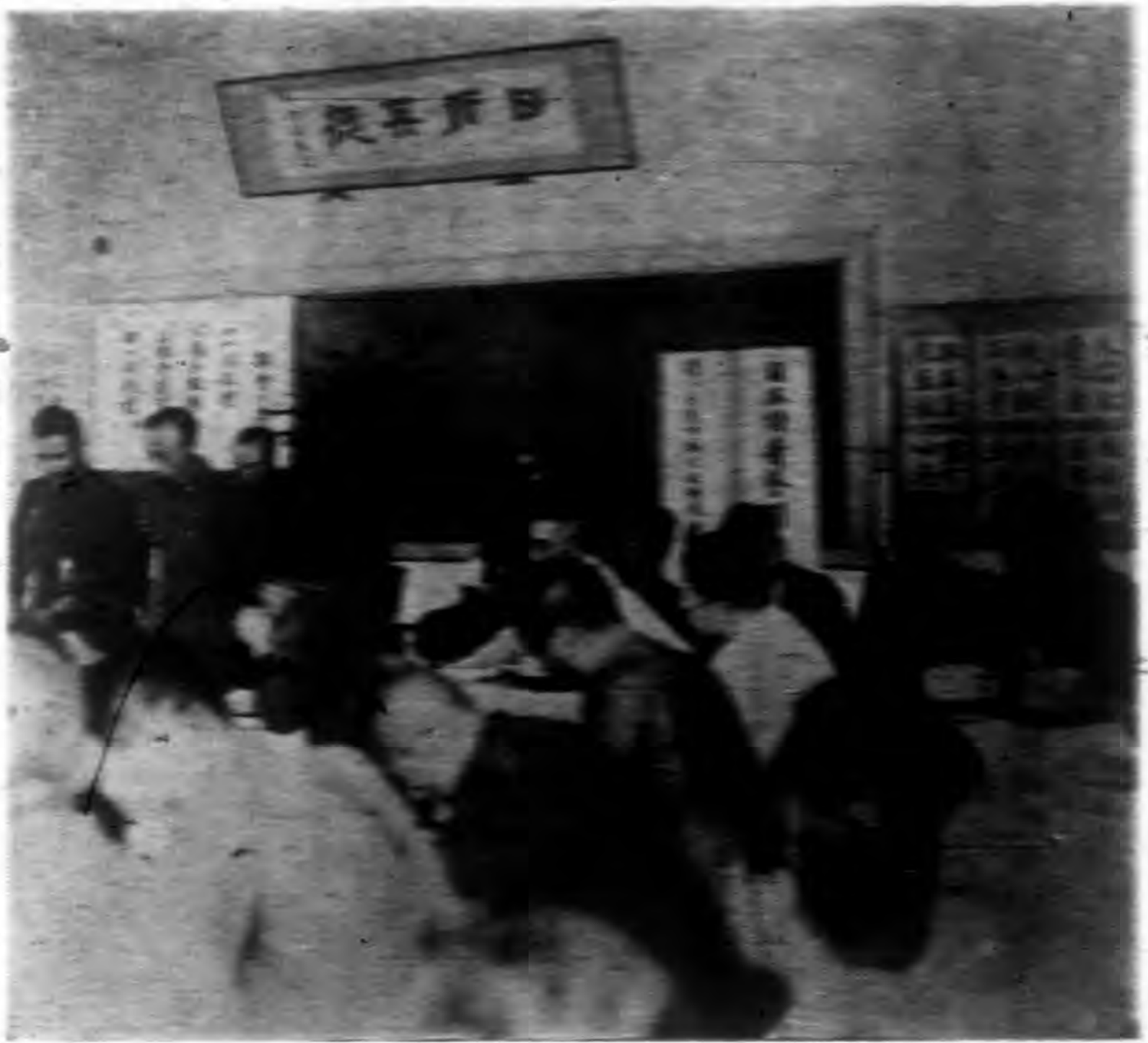
（會話）教育部重光堂

語，其方法雖有許多，然而必須達到耳之所聞莫非都有日語的程度。例如除法令軍隊用語學校教育均行使用日語外，凡報紙、雜誌、兒童讀物、電影歌曲招牌等均行使用日語。