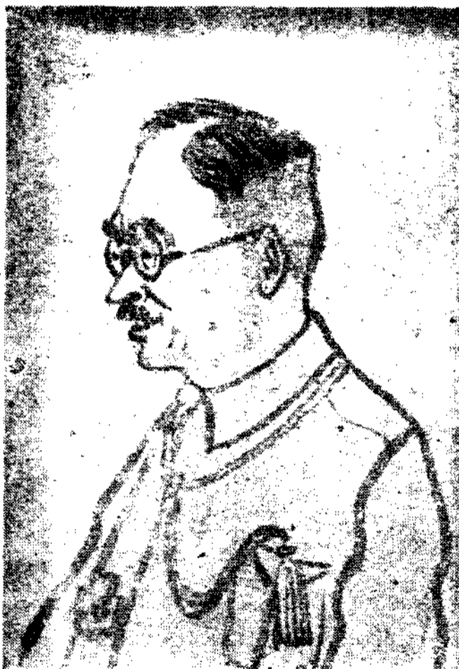
( 長 議 田 宇 )