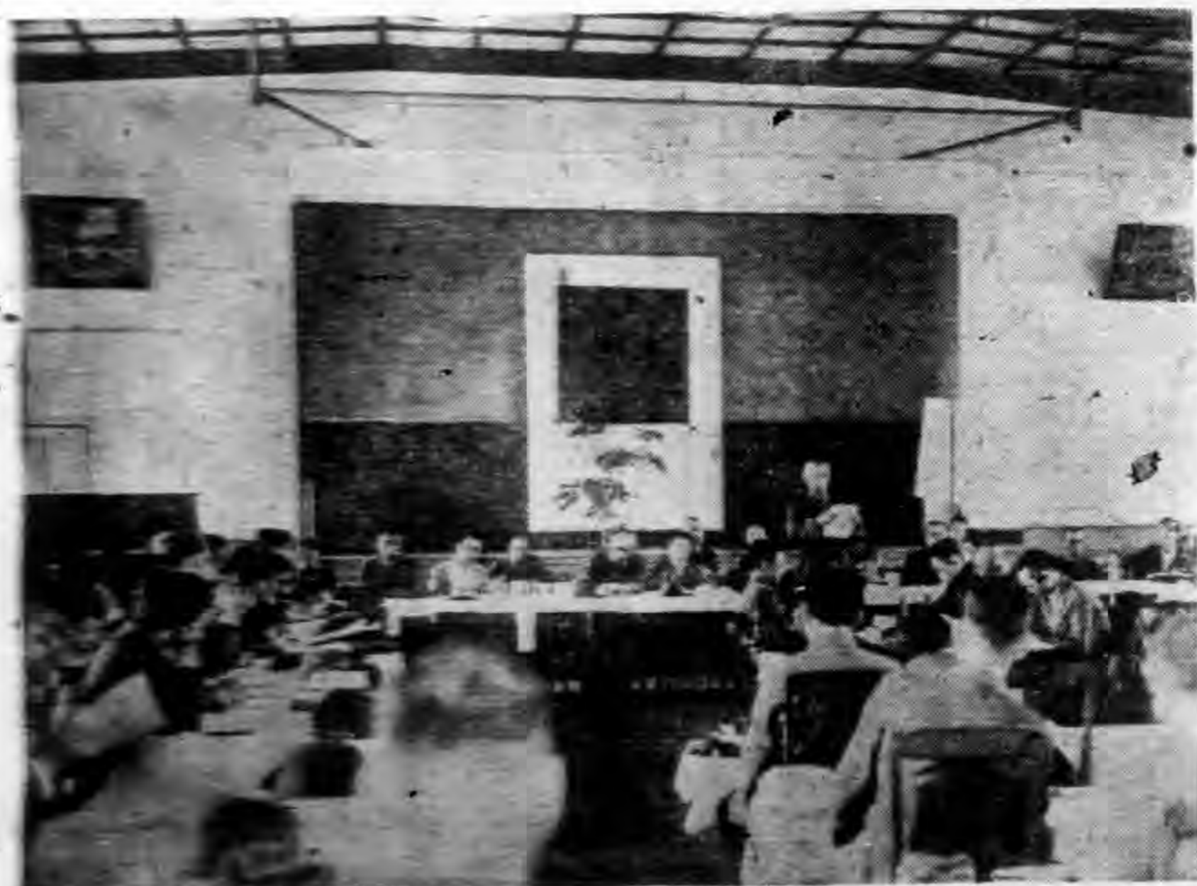
(景光會部育教等初)