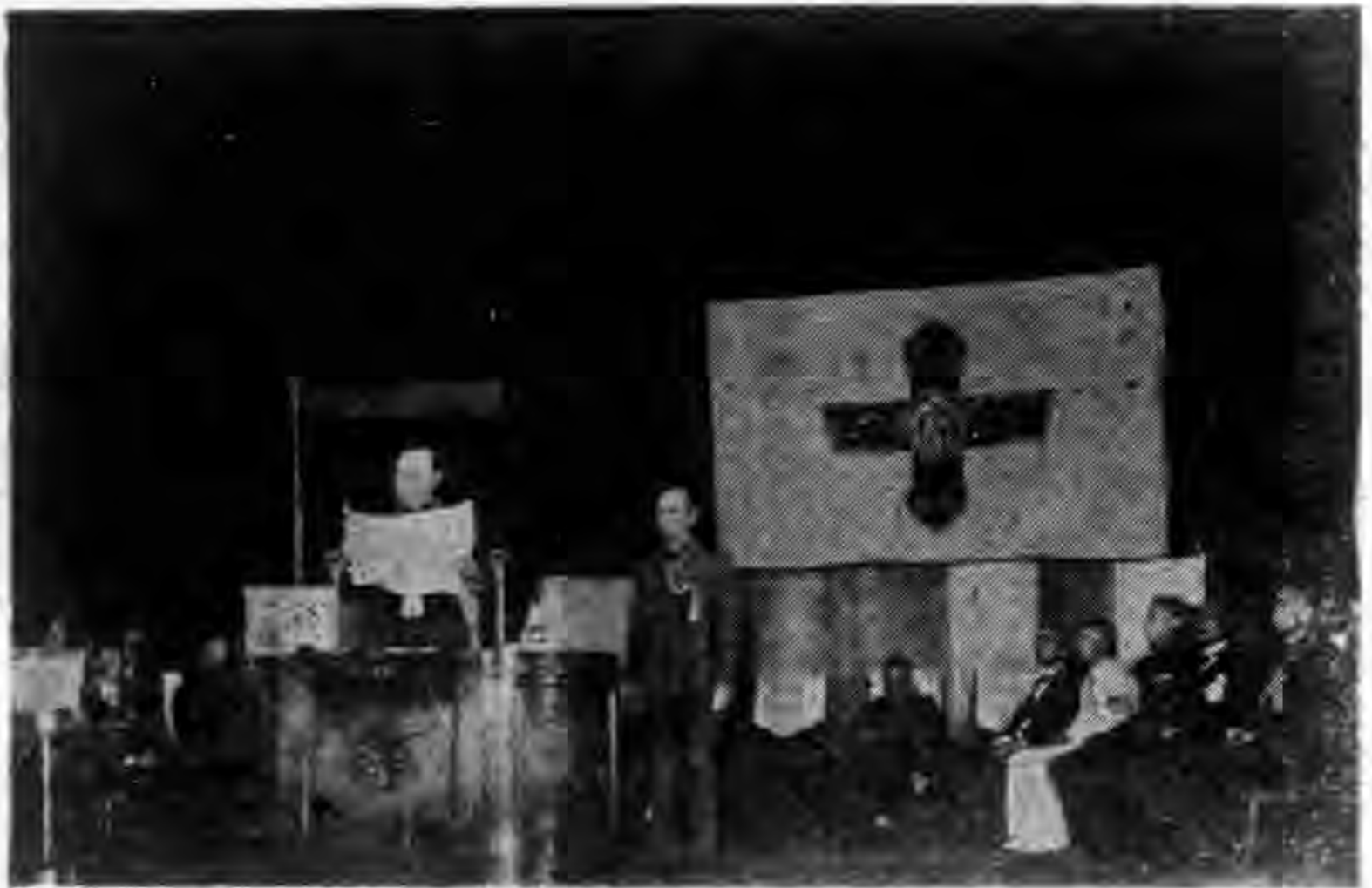
(答大會會長致開會詞)