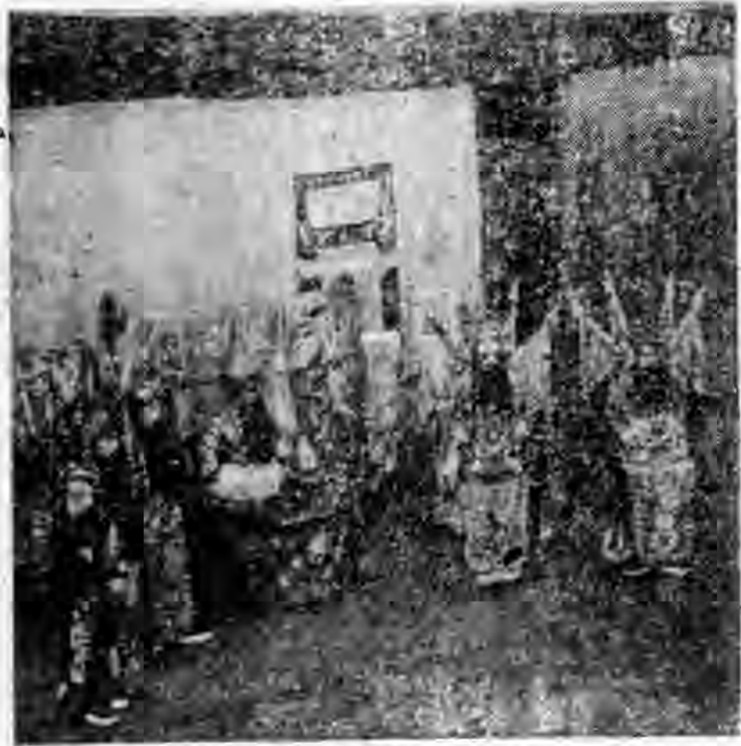
(圖 場 劇 藝 洲 滿)