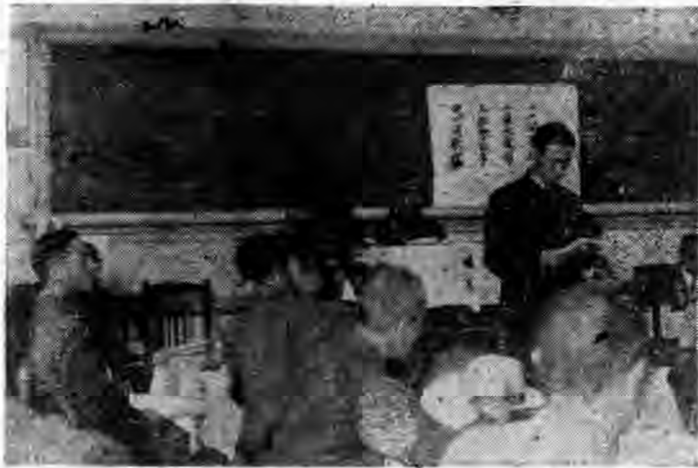
(會部育教術技學科)

(三) 於學科所教授的內容、其範圍不要寬泛而取羅列式、應以體得及練成為主眼而指導之。 (四) 對於各學科、在教授時、均應伴行演習、實驗、實習