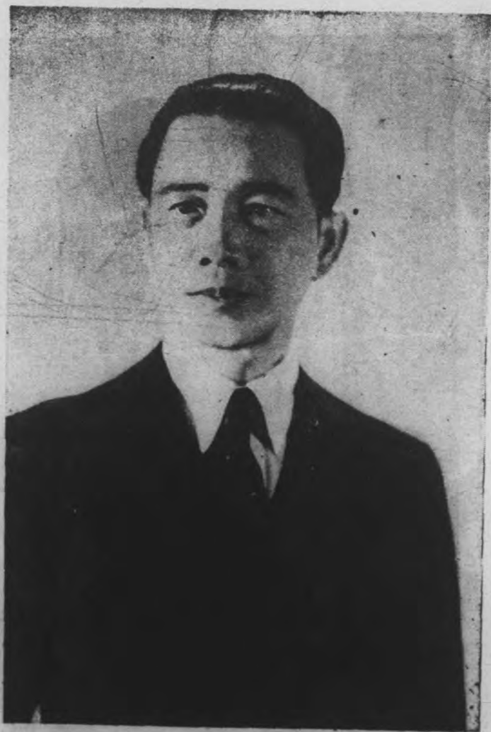
汪 委 員 長 玉 照