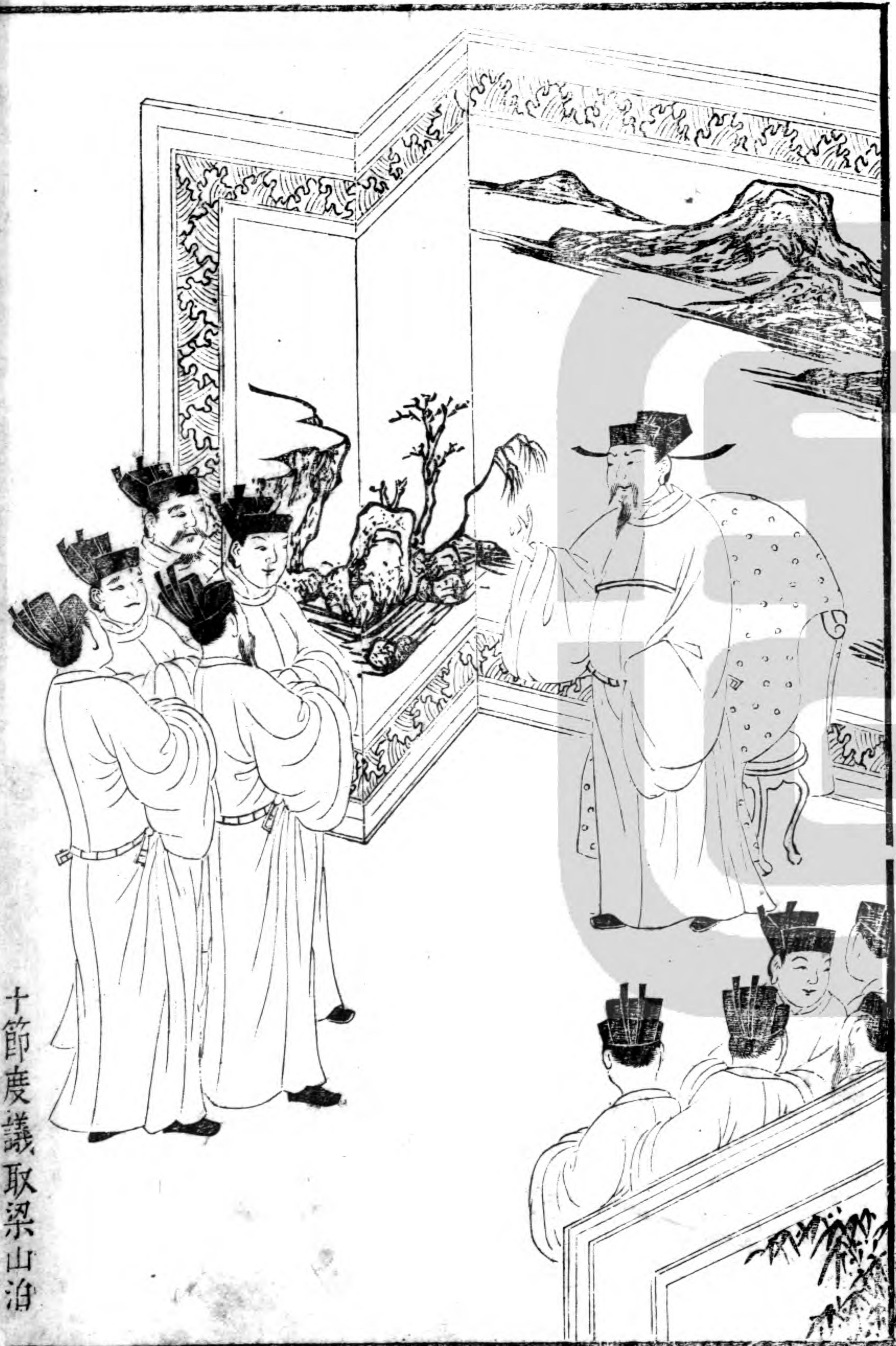
十節度議取梁山泊