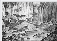
Great Moon Hoax předběhl tradici fake news již v roce 1835

Fake news (doslovně „falešné zprávy“) jsou žánr tzv. žluté žurnalistiky (bulvární či neetické novinařiny) úmyslně šířící dezinformace či hoaxy za účelem ovlivnit a zmanipulovat příjemce. Do žánru fake news nepatří parodie či satira. Doménou fake news v současné době bývají dezinformační weby, sociální sítě, šířeny ale mohou být prostřednictvím všech mediálních platform. Původem tak sahají i do doby vynalezení knihtisku.[3] Za jednu z nejstarších a zároveň plně moderních kauz tohoto druhu je považován tzv. Velký měsíční podvod (Great Moon Hoax) z roku 1835, k němuž došlo ještě před vznikem neologismu „fake news“.