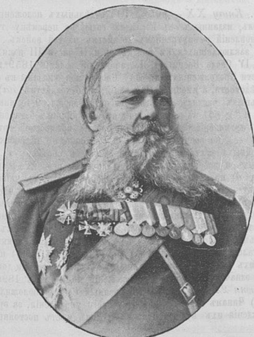
Генераль-маіоръ Алексѣй Павловичъ СУРАЖЕВСКІЙ.

ПУСТОЙ ПРИУТЬ ген.-отъ-инф. Г. Г. Бѣлоградскаго для круглыхъ сиротъ офицерскаго званія (смотри «Развѣдчикъ» № 317, стр. 1000), есть свободныя вакансіи.