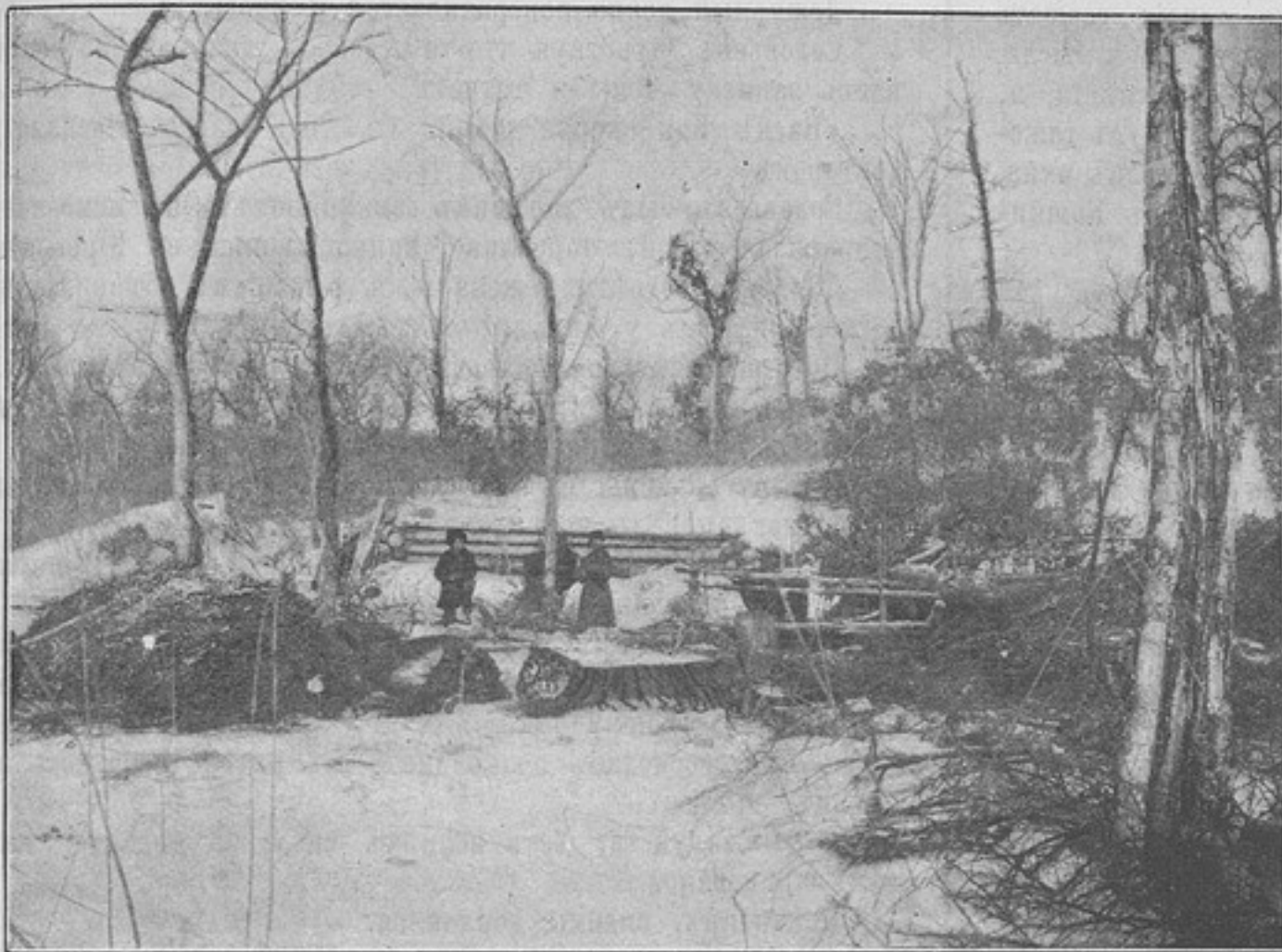
Осторожно стали мы подходить къ затихшему звѣрю.

На такомъ-то зимовьѣ*) 1-го Восточно-Сибирскаго стрѣлковаго Его Величества баталіона поручикъ Бодиско разсказалъ намъ слѣдующее: