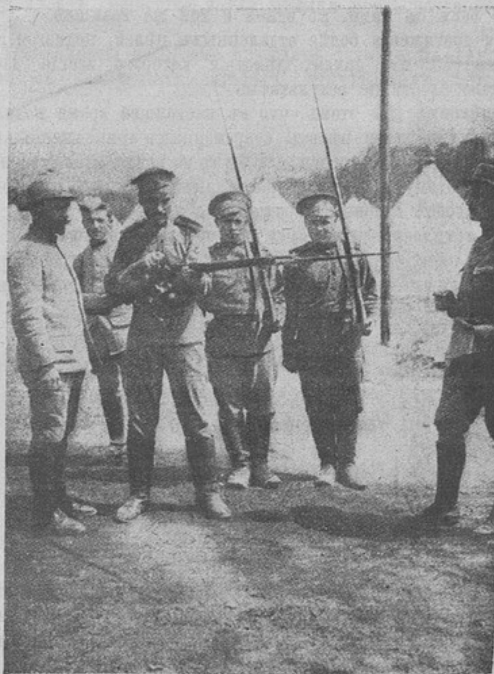
Французскій пѣхотинецъ обучаетъ нашихъ солдатъ во Франціи стрѣльбѣ изъ французскихъ винтовокъ.

Корреспонденту пришлось встрѣтиться еще съ другимъ пулеметчикомъ, также оставшимся въ районѣ боя безъ това-