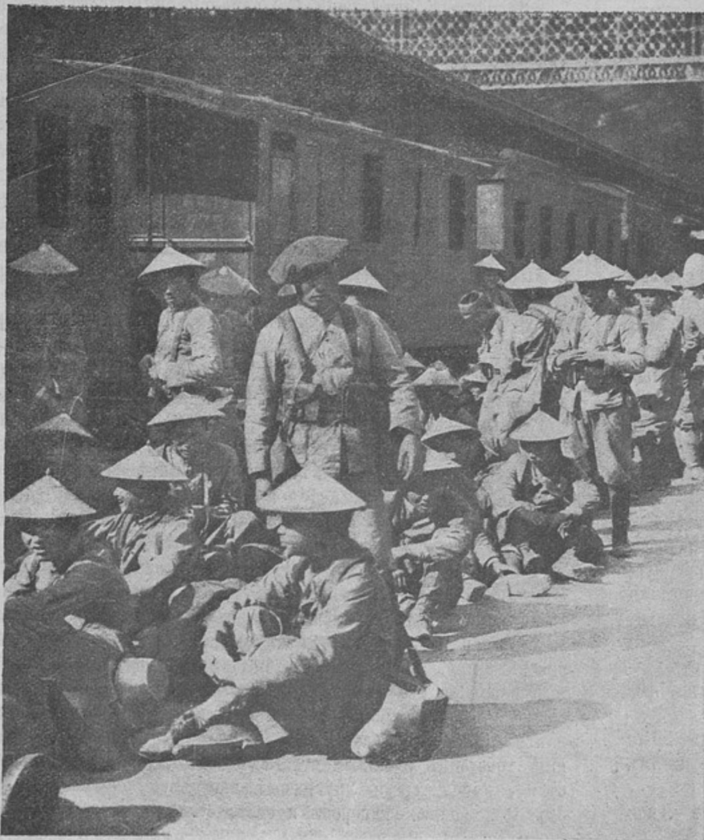
Прибытіе аннамитскихъ стрѣлковъ въ Парижъ.

тѣмъ создать новый водный путь для соединенія теченій рѣкъ сѣвернаго и южнаго бассейновъ, правительствомъ были приняты обширныя работы по прорытію канала, связавшаго между собою рѣки Пину и Наревъ.