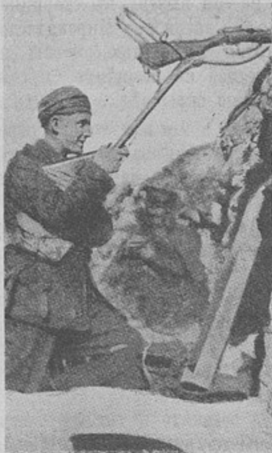
Стрѣльба изъ винтовки при помощи перископа.

телефона уже передаютъ распоряженіе командирамъ отдѣльныхъ частей прибыть въ штабъ.