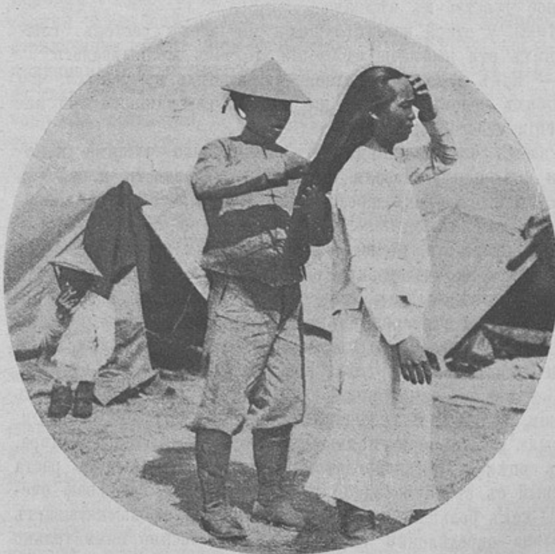
Стрѣлокъ-аннамитъ за утреннимъ туалетомъ. («Schw. Ill. Zeitung».)

Телефонисты поспѣшно проводятъ телефонныя линіи для связи съ корпуснымъ штабомъ, откуда послѣ постановки