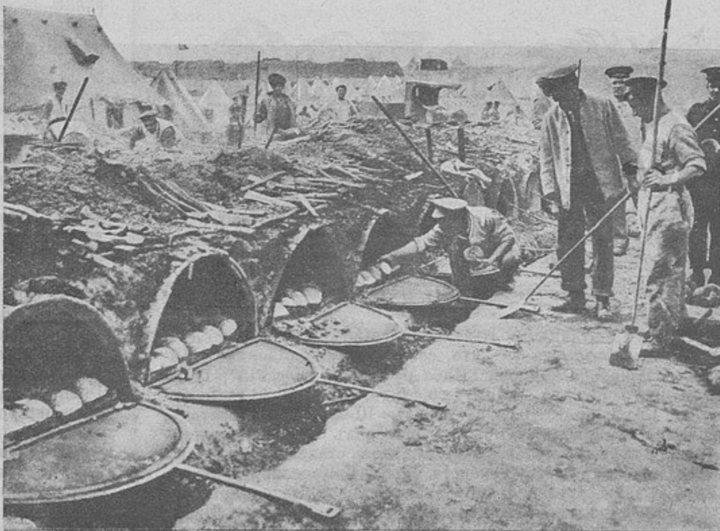
Англійская хлѣбпекарня въ Солуни.

— На лѣвой сторонѣ канала всѣ передовыя нѣмецкія части уничтожены, въ то же время нѣмцы подвезли большія