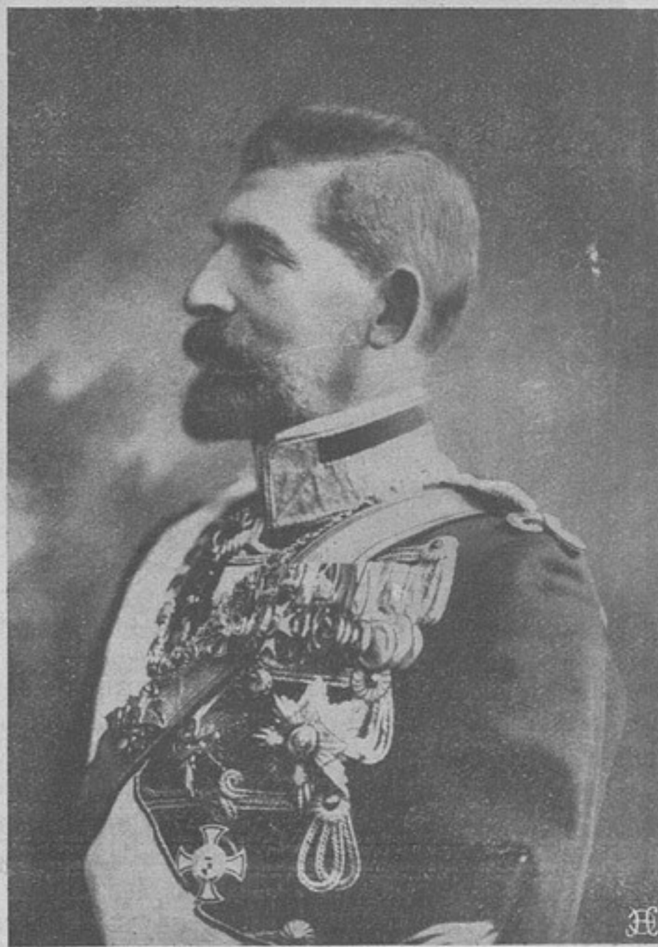
Нашъ новый союзникъ Король Румынскій Фердинандъ I.

О такомъ видѣ помощи раненымъ воинамъ Главный Штабъ объявляетъ для свѣдѣнія уволенныхъ въ первобытное состояніе нижнихъ воинскихъ чиновъ и учреждений, въ вѣдѣніи которыхъ означенныя лица состоятъ («Руск. Инв.» № 213).