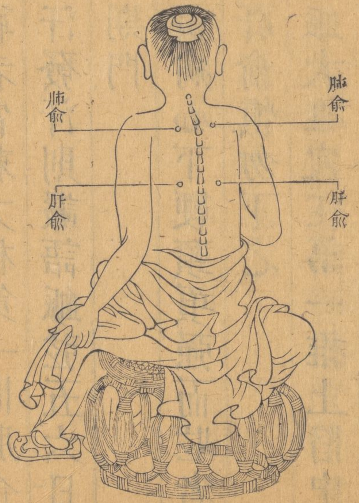
太陽少陽併病刺大椎肺俞肝俞穴圖