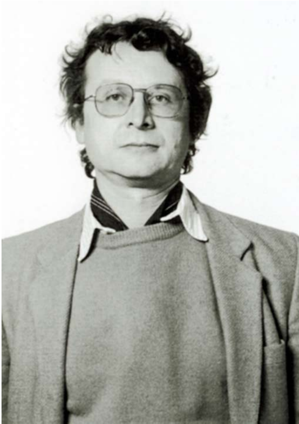
Tristan Murail

terwijl basiskenmerken van de symfonie zoals de extraverte expressie, de instrumentale dramatiek en “de wil om de hele wereld te vatten in een symfonie” (G. Mahler) aanwezig blijven. In weerwil daarvan is Brewaeyts’ spectrale harmonie vrij statisch: slechts enkele grondtonen leveren het spectrale materiaal op voor een volledige compositie. Elk van de grondtonen wordt verschillende minuten aangehouden, maar tegelijkertijd door retorische of quasi-improvisatorische gestes expressief ingevuld. Om wat kort door de bocht te gaan: de ‘achtergrond’ is statisch-spectraal, de ‘voorgond’ is retorisch-expressief. In de benadering van de ‘voorgond’ zitten heel wat gemeenschappelijke trekken met de muziek van Iannis Xenakis en Brian Ferneyhough, die overigens in het begin van Brewaeyts’ carrière ook als diens mentor fungeerden.