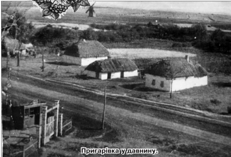
Пригарівка у давнину.

Події сучасного життя тісно пов'язані з великою кількістю старих і нових географічних назв, які потрібно усвідомити. Навіть щоб дивитися телепередачі,