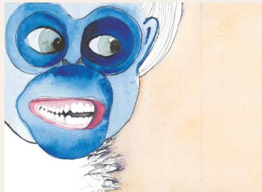
A monkey's face

Naha dingaranan Rahwana? Ngaran asli Rahwana asalna Dasamuka. Dumasar carita Ramayana, kacaritakeun yén Rahwana pernah nyieun ambek Raja Monyét Vaali anu keur ngadu'a di gunung. Rahwana ahirna diusir, lantaran Vaali ringrang ku polahna Rahwana. Ti saprak harita, anu awalna nginget ku ngaran Dasamuka, ayeuna robah jadi Rahwana.