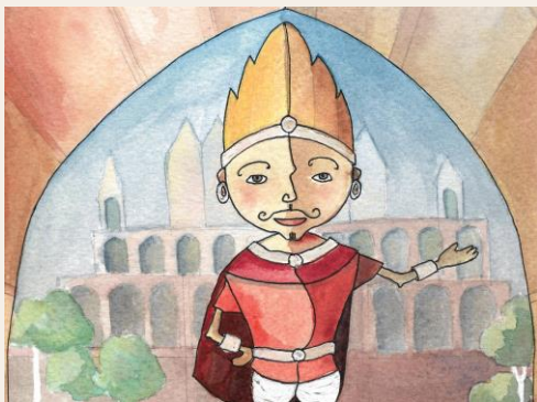
The king standing in front of the palace , Meenal Singh , Story Weaver, CC BY 4.0 .

Rahwana katelah jahat, lantaran manéhna nitah Brahma sangkan leuwih jago tibatan manéhna. Ku kituna, Rahwana katelah adigung jeung gedé hulu. Ka dulurna sorangan ogé jahat. Kuwera téh dulurna Rahwana anu mingpin karajaan Aléngka. Tapi éta karajaan direbut ku Rahwana, tuluy nitah Kuwera pindah ti éta karajaan. Masarakat India ti sababaraha generasi ngilu ijid lantaran polahna Rahwana. Carita anu pangkasohorna nyaéta, Rahwana nyulik Déwi Sinta ti Rama. Sanajan Rama geus ngahampura kana kalakuan Rahwana, tapi loba masarakat India anu masih can ngahampura kana polahna. Nepi ka aya tradisi di unggal taun pikeun ngaduruk patung Rahwana.