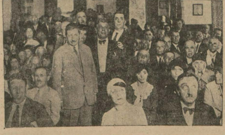
Dün gayrimübadiller toplandı. Yukardaki resim gayrimübadilleri gösteriyor. Yazısı iç sahifemizdedir.

Trakyada da kıym fazla olması ve yağmursuzluktan mahsul bereketli görünmemektedir.