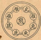
射 侯 圖

此射鵠也。南中頗少。北方則多。旗人習者尤衆。凡五層。中央最小者。爲金羊眼。此九種原圖。皆繪其形。與今之鵠外同而中異。以爲飲酒之令。醉翁亭記。所謂射者中。弈者勝。觥籌交錯是也。歐陽文忠公歸田錄。九射之格。其物九。爲一大侯。而寓以八侯。熊當中。虎居上。鹿居下。雌雉猿居右。雁兔魚居左。而物各有籌。射中其物。則視籌所在而飲之。射者。所以爲羣居之樂也。而古之君子。以爭九射之格。以爲酒禍起於爭。爭而爲歡。不若不爭而樂也。故無勝負。無賞罰。中者不爲功。則無好勝之矜。