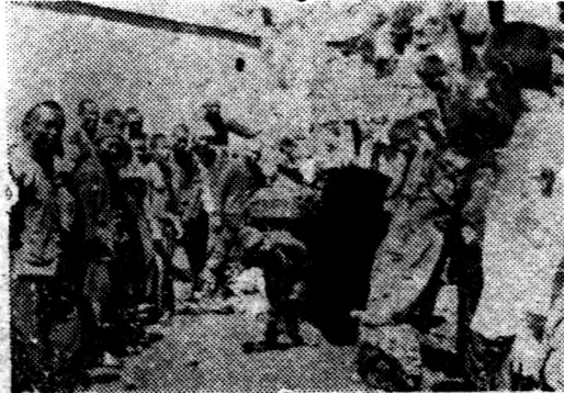
包頭石拐溝之炭礦，為綏包唯一燃料供給地，此為工人背負一五〇市斤炭塊，出窯情形