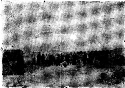
包頭綏昌窯業，向賴難民開工製磚