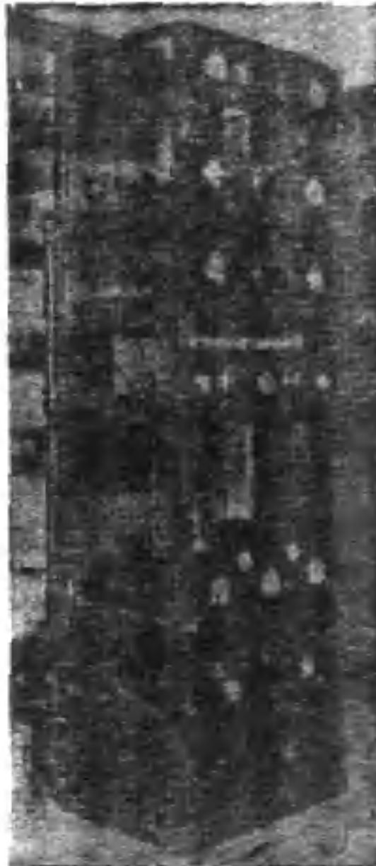
固定式短波發報機(電力自一百瓦特起)

本公司承製各項軍用商用船用大小機器如承各界訂購無不竭誠歡迎 短波軍用無線電機通信範圍 小型收發報機...一百五十華里 十五瓦特收發報機...七百華里 五十五瓦特收發報機...二千華里 一百瓦特收發報機...三千華里