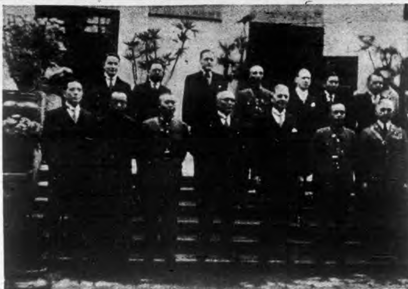
← 雲陔、李宗仁、鄒魯、 士、陳濟棠、鄧恩、林 留影（自右而左：霍琪 美國陸軍部長鄧恩抵粵