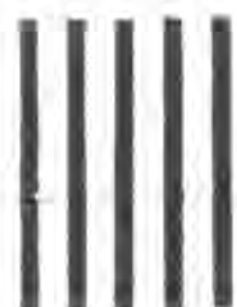
特報創刊號，一九〇四年出，距今卅一年。