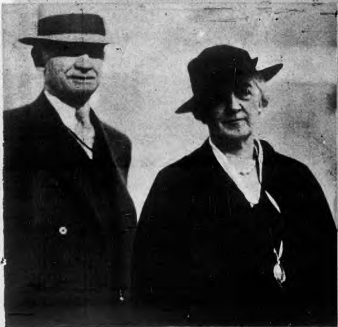
、美國眾議院議長 貝恩夫婦抵滬時