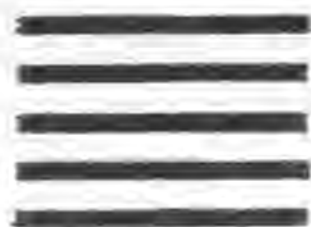
占石齋畫報為我國最早之圖畫新聞，係英人美查氏創辦。