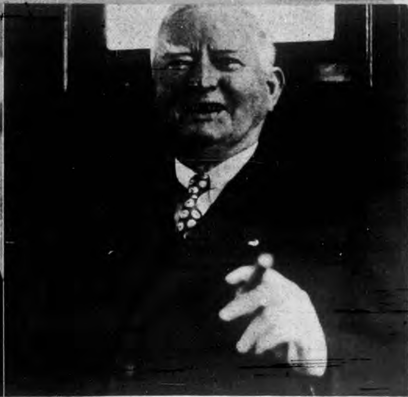
▲ 美國副總統迦納赴菲過滬時