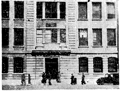
本館現用館舍外景