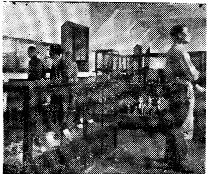
復館後陳列室之一部