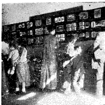
復館後特種展覽會之二