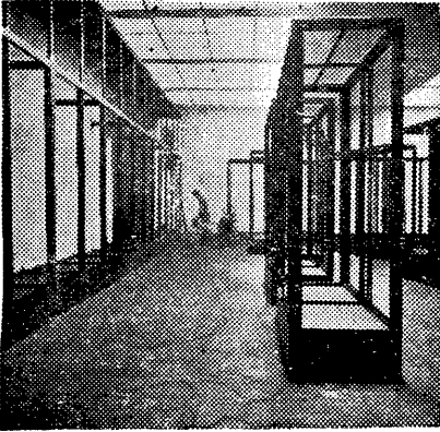
戰前本館陳列室之一部