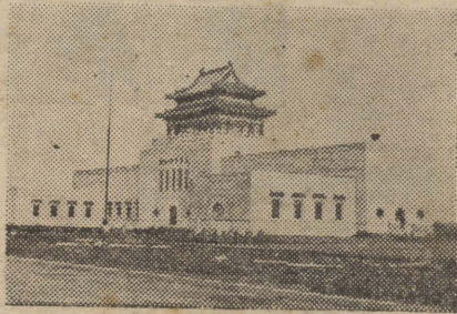
本館江灣市中心區館舍外景