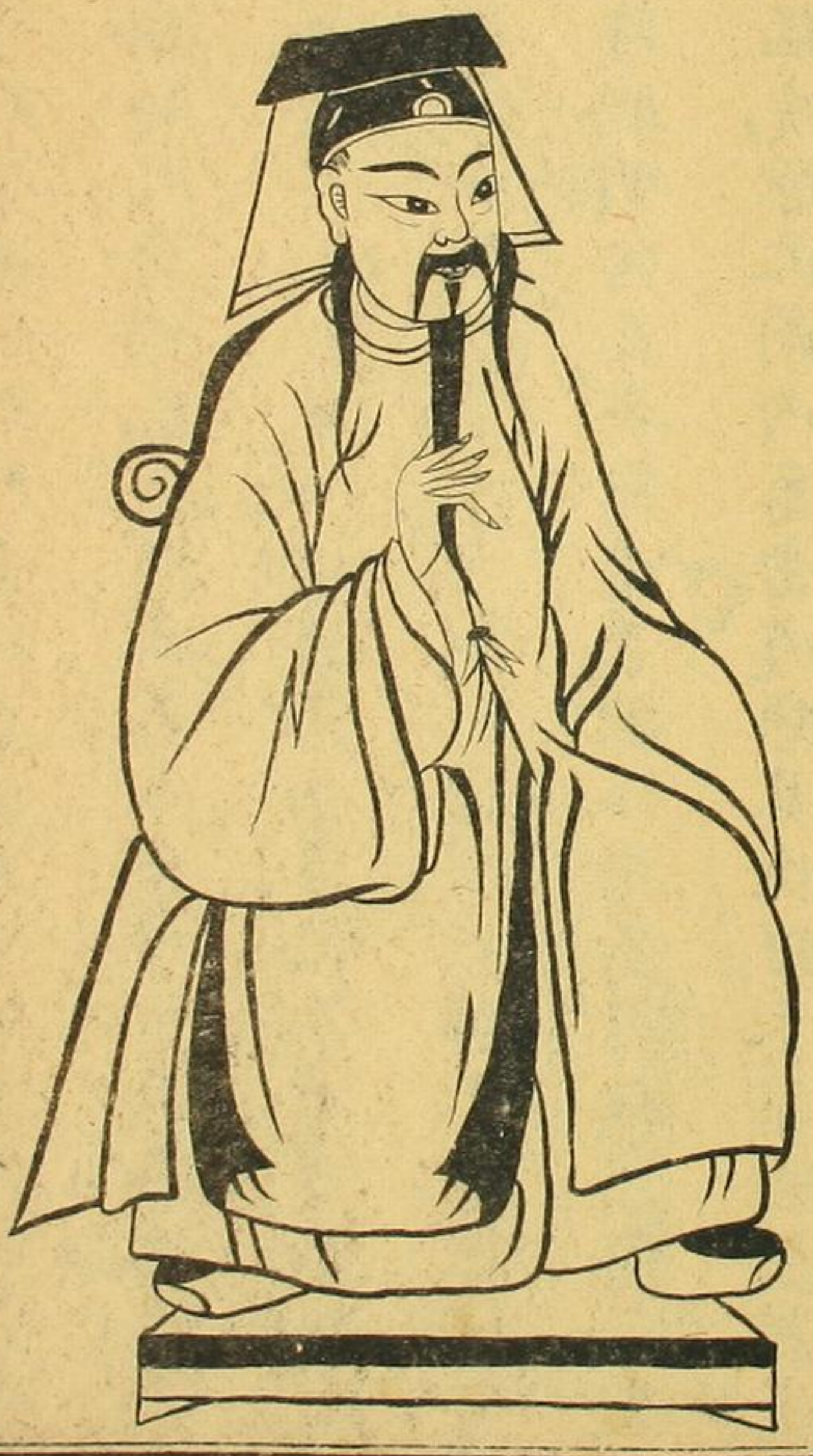
元儒 吳澄 官至 中書