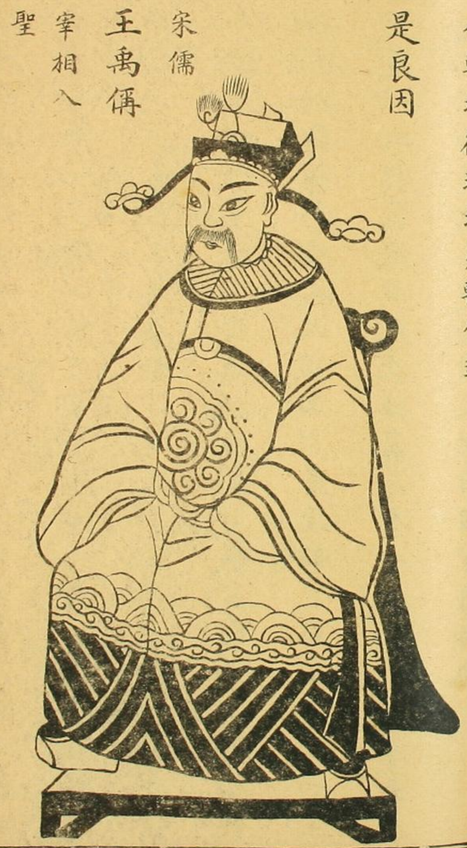
宋儒 王禹偁 宰相 聖