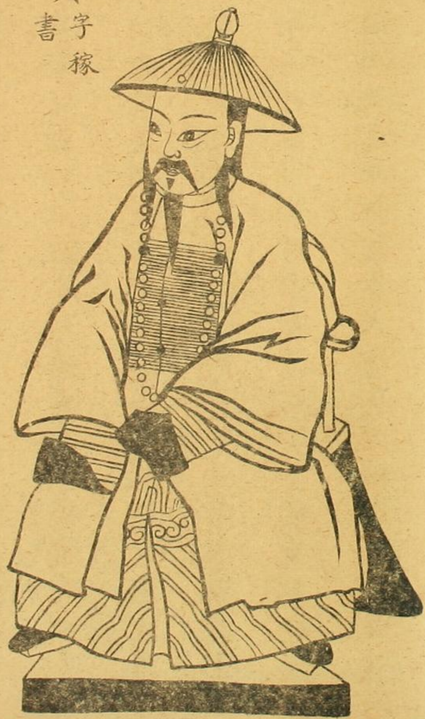
清儒 陸隴其 字稼書 康熙臣

壬寅四月三十日清宰思忠李夫子降壇愚問道學之別 名何其多耶箕動曰惟有性命神氣精五者而矣再者陰 陽魂魄鉛汞前三田後三關若是其無多者若經書蓋多 名者故後學不易得即得恐不以是為重實聖傳經亦不 能真漏天機也詩曰前後六關與三田泥丸元氣合玄關 蓋天全通周身處經典別名有萬千因姓起諱諱又號著 書成籍籍抄單總有老儒孰能記成學何在須多般