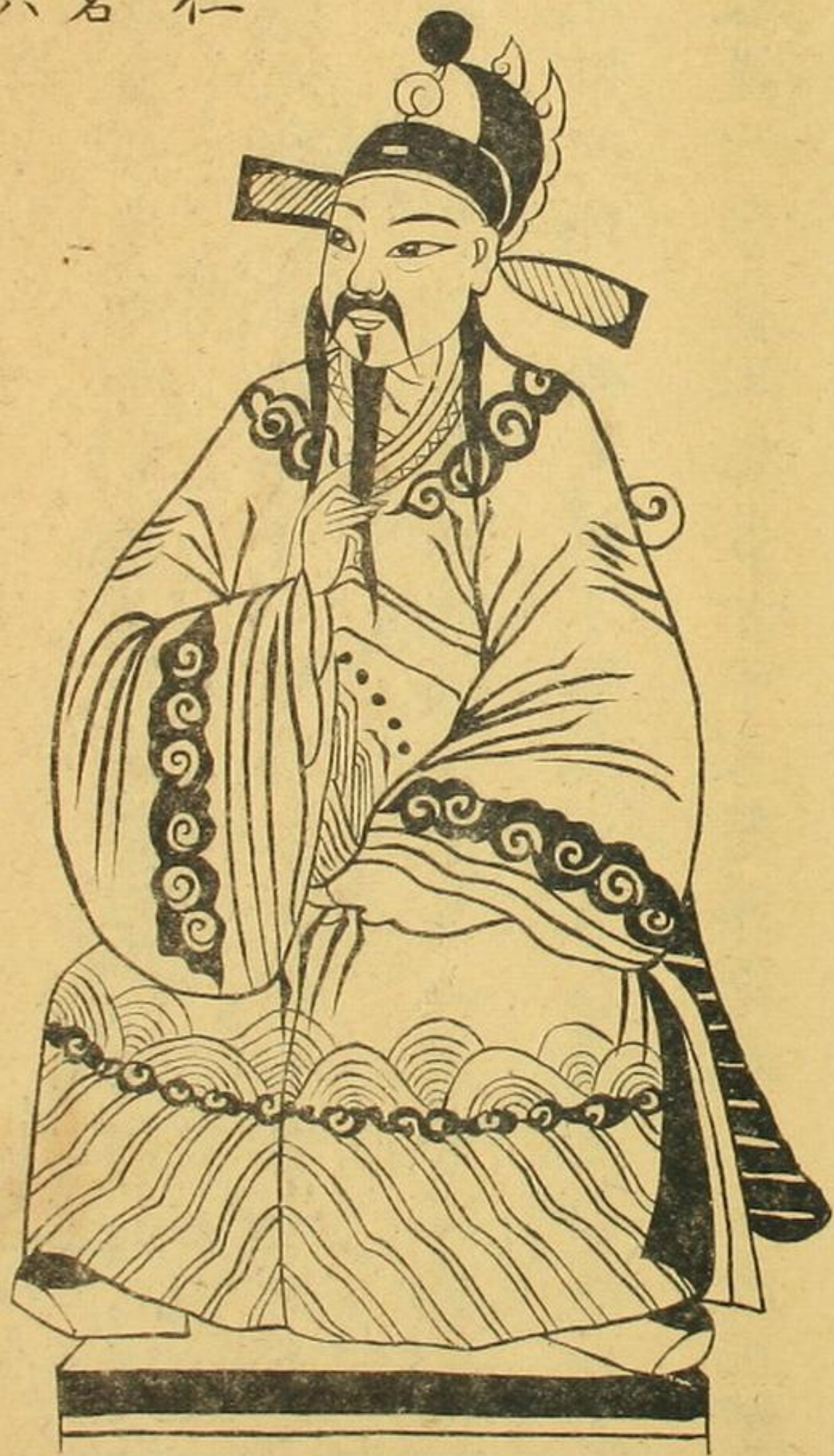
明儒 胡居仁 理學名 臣十六 人內