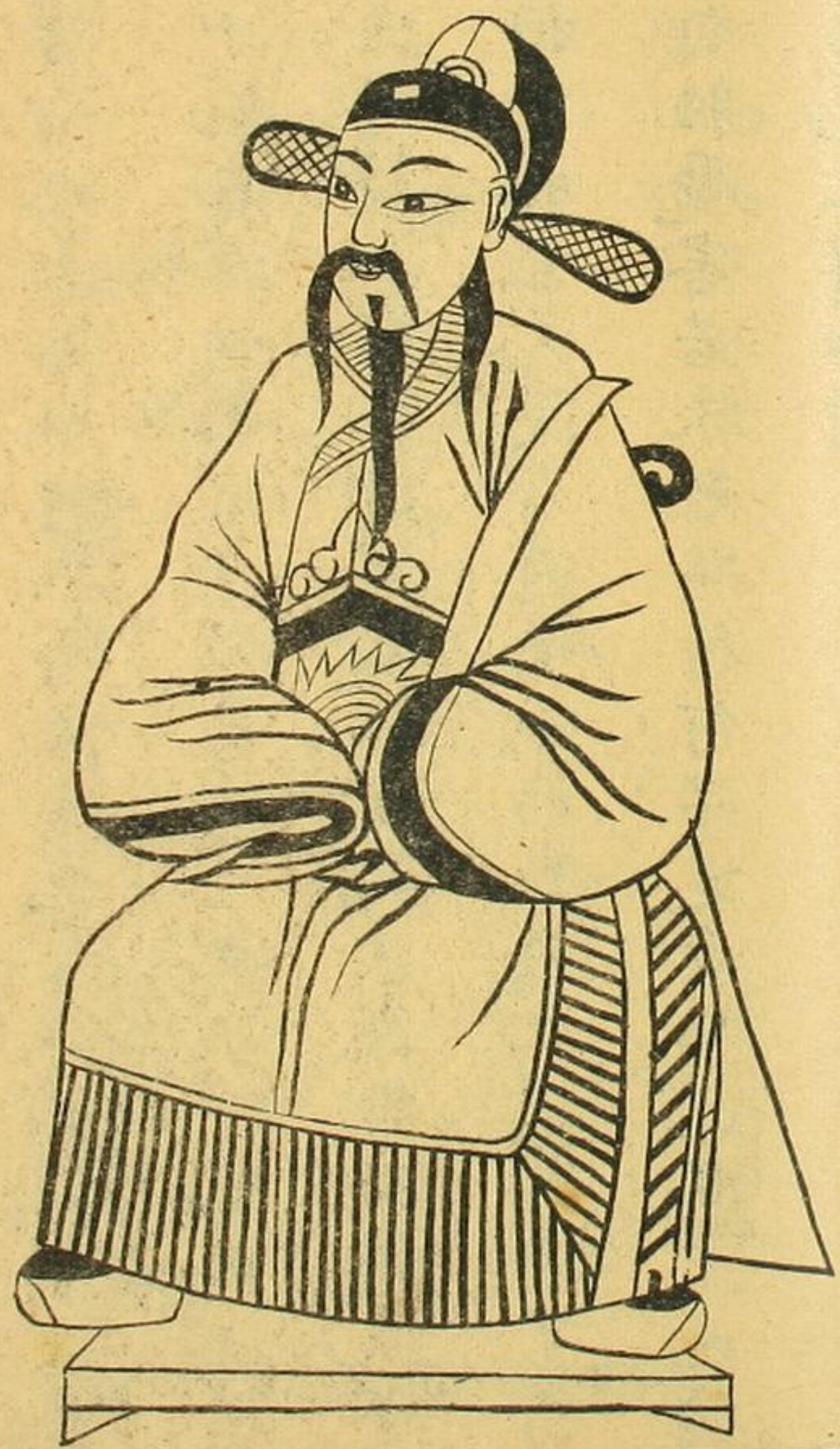
宋儒 曹端 宋中 書官

宋賢 卷二十八 是月十九日平仲冠策公夫子臨箕愚問道之原初乩曰 求道源問叅玄神仙還得神仙作那有凡人作神仙作神 仙必得用那神仙法若用凡術成仙難上蒲團觀丹田道 之初功一步先問少候指玄閑如經庸師亦難言非不言 知不全多覽丹書皆糊含糊含糊實糊含糊本是俗子無 仙緣多積德少結冤涵養栽培可為善善德大感應天再 求道須不難這就是成神為仙入聖超凡的大根源