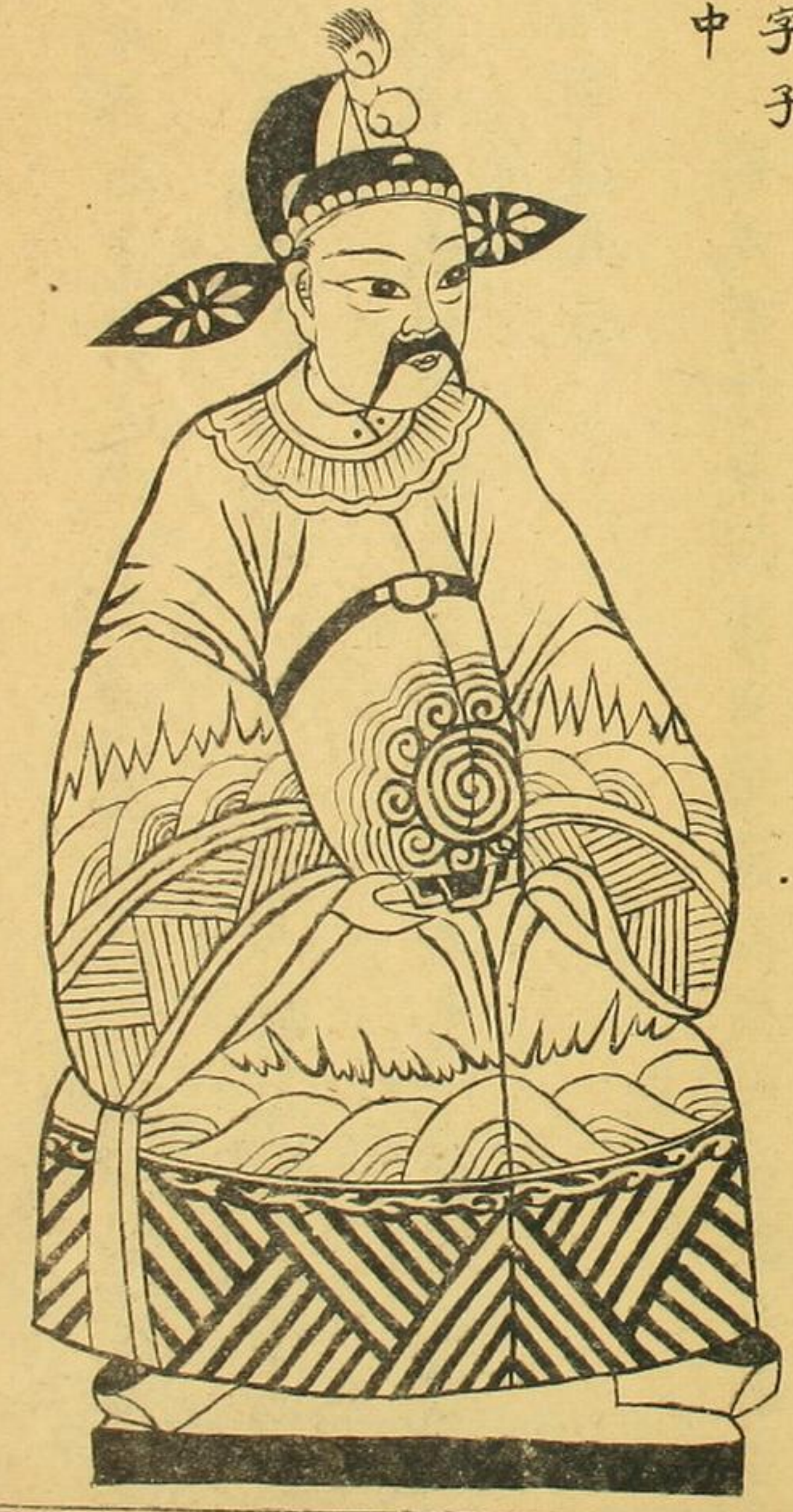
明儒 蔡清 字子中 理學 翰林 名臣 十六 人內 又中 堂也 青史

明理學瑄公薛夫子降鸞曰儒有道德之為因是有修身 之作夫道德者 聖嘗言賢嘗講務本者道也以政者道 也修身須臾不離者道也故大道必實其言其行其忠其 信者也為政者德也專修者德也祭祀慎終追遠者德也 故大德必得其位其祿其名其壽者也大凡人明道者為 賢士人有德者為名儒古賢士名儒講道德而今後學道 德不可不講也