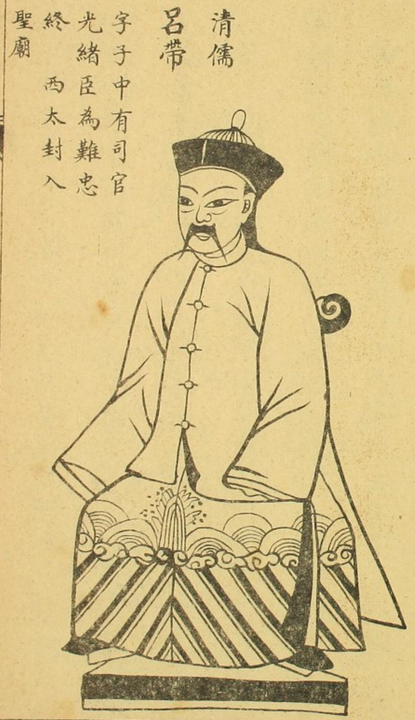
清儒 呂帶 字子中有司官 光緒臣為難忠 終西太封入 聖廟

是日也爾丹夫子臨札書說王金升清之忠臣時入聖廟 亦當繪像著於經中愚即送富請王問明花甲官職又問 世道緣由驚動詩曰人居中華最安然化宰勸殺幾千番 人人自能用己力個個皆明有菓園金山風生草乃動銀 水不流自有源白由朱出升鉛汞命中無緣得道難 詩又全 人全命命在天不可財上起禍端為人為己又為眾升殿 升堂亦升仙有緣有分有我你同到鳳池看一番