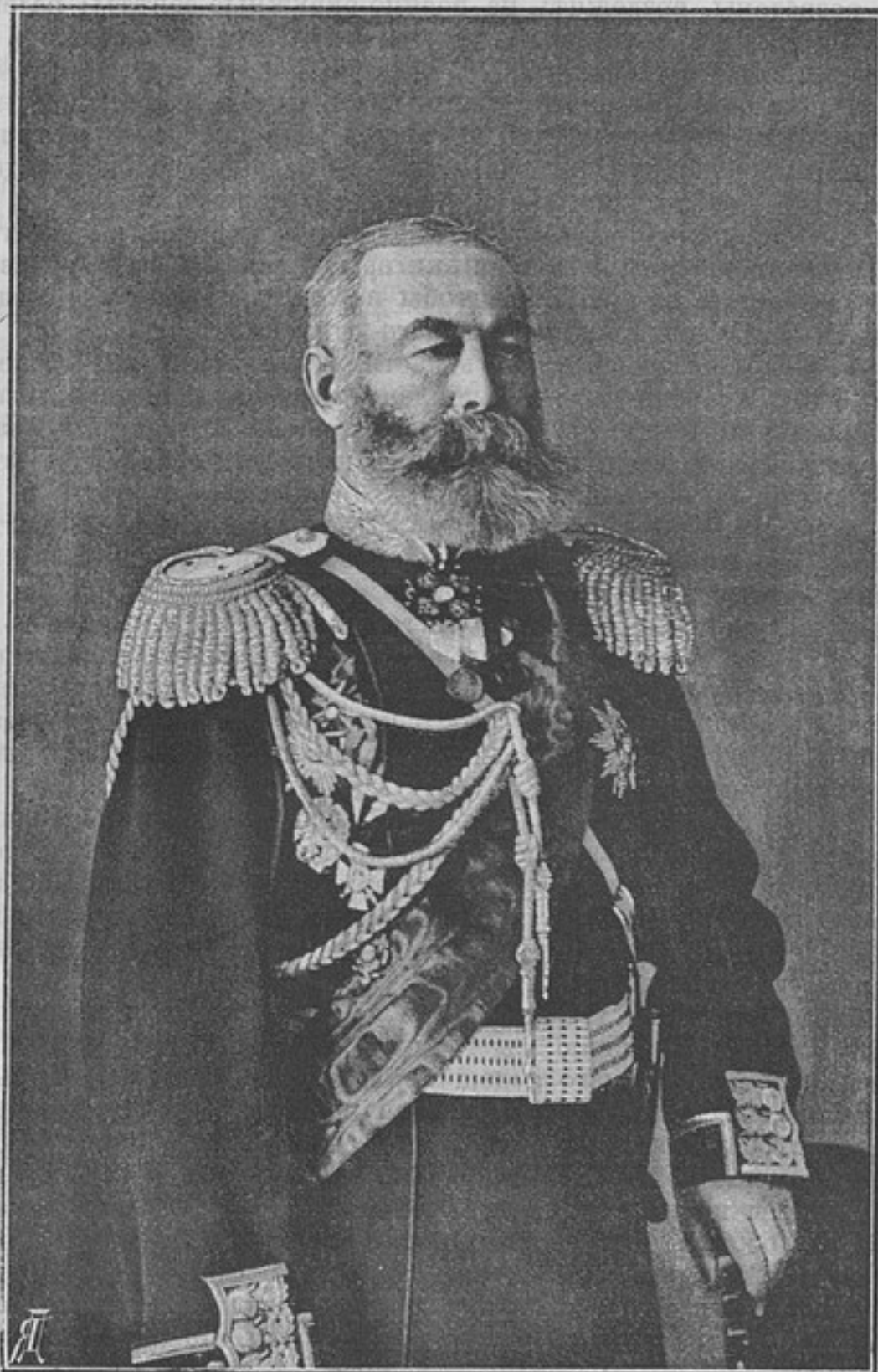
Начальникъ 48-й пѣх. рез. бригады, генераль-маіоръ