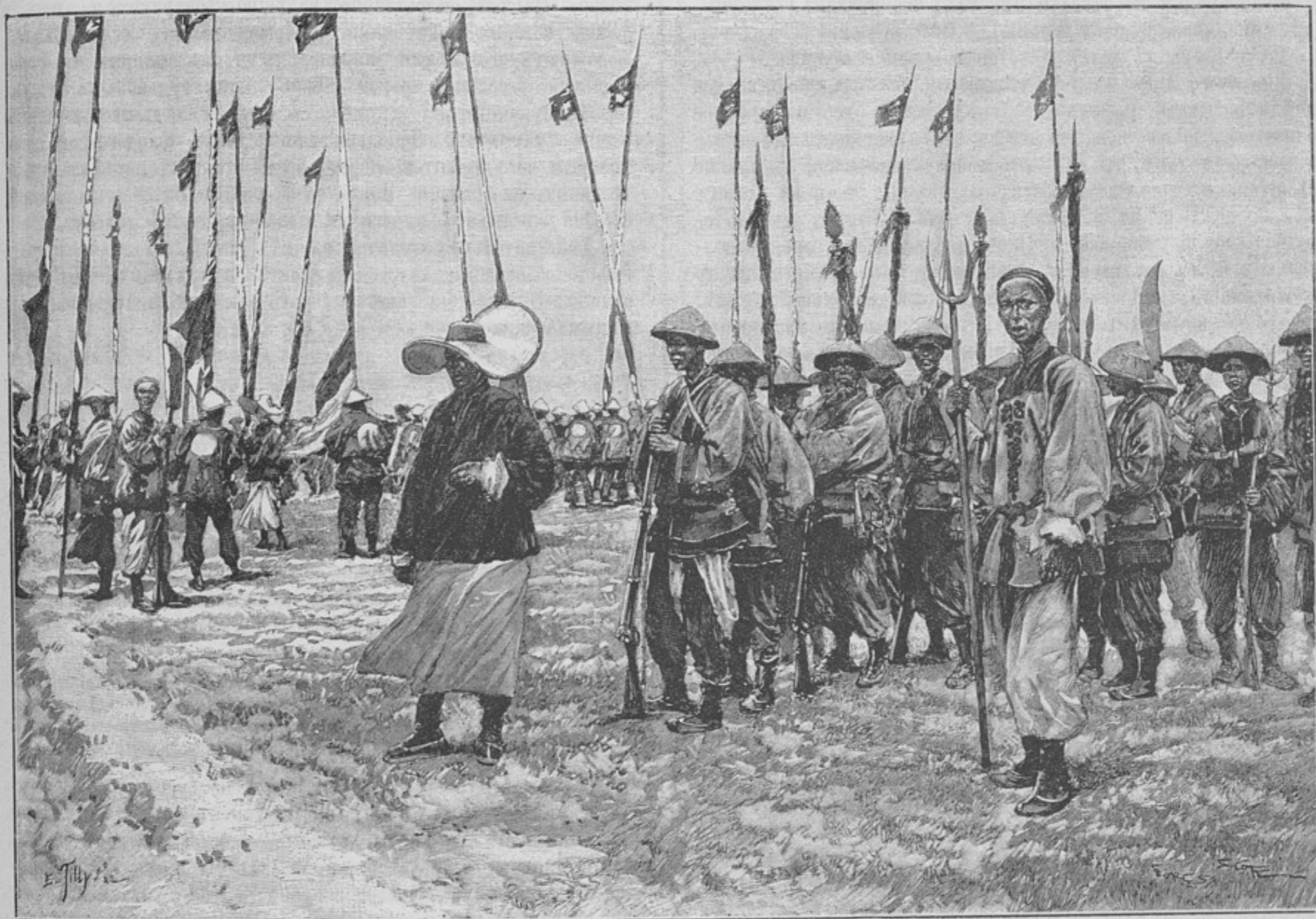
Китайская армія. Сборъ на ученіе въ Вузунгскомъ лагерѣ близъ Шанхая.

4) Полковая лавочка задается двумя совершенно несовмѣстимыми цѣлями: 1) дать офицерамъ хорошіе товары по недорогимъ цѣнамъ и 2) имѣть большой оборотъ и извлекать, благодаря этому, значительную прибыль. При хорошемъ товарѣ, при его сравнительной дешевизнѣ, при большихъ оборотахъ торговли, какъ начальство, такъ и общество полка довольны