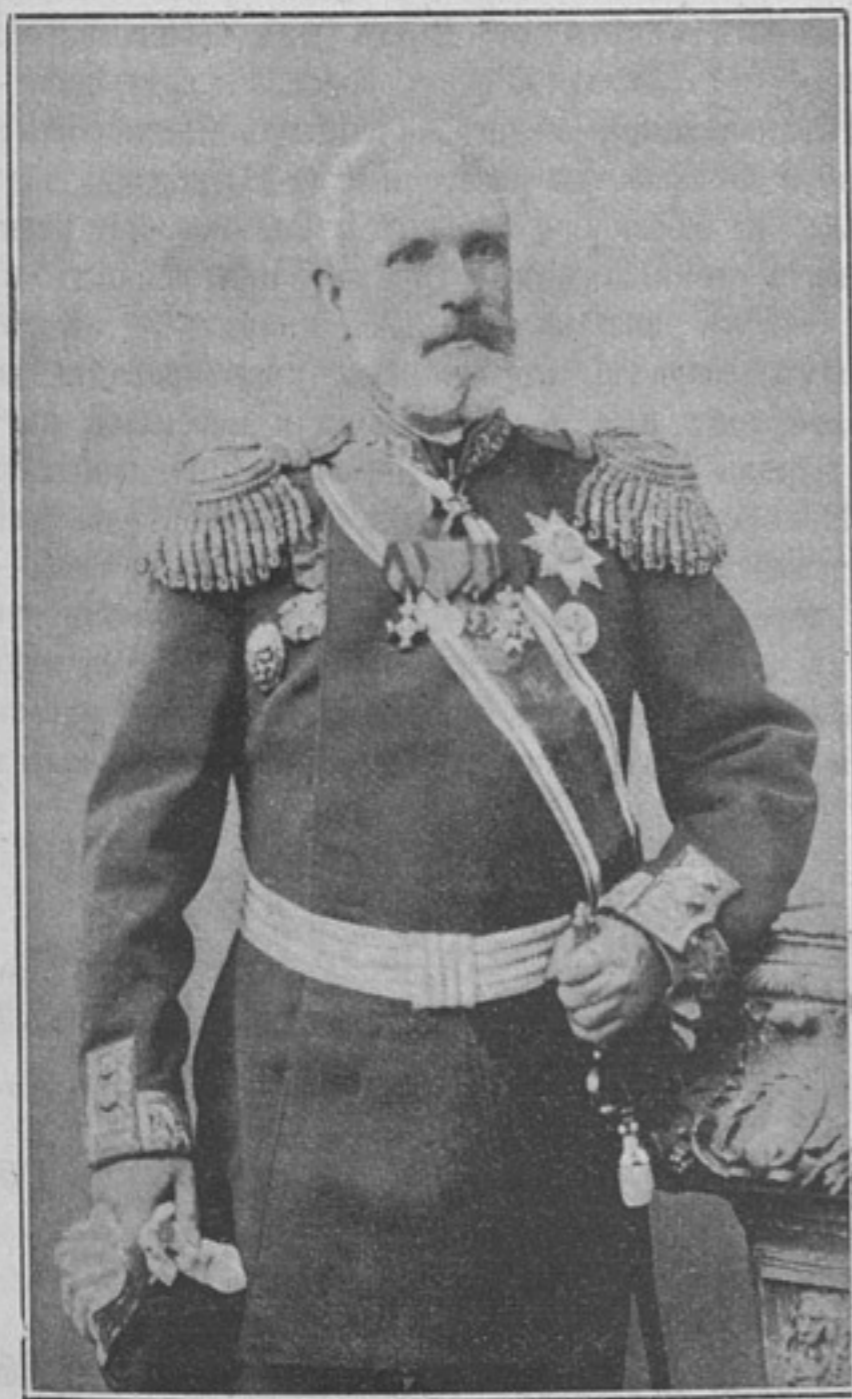
Командантъ крѣпости Выборга, генераль-маіоръ Несторъ Никифоровичъ КАЙГОРОДОВЪ.

Экземпляры сданы почтамту одновременно для подписчиковъ, внесшихъ годовую плату полностью при самой подпискѣ, а потому не получившіе озна- ченнаго приложенія благоволятъ немедля сообщить объ этомъ въ редакцію, для заявленія почтамту.