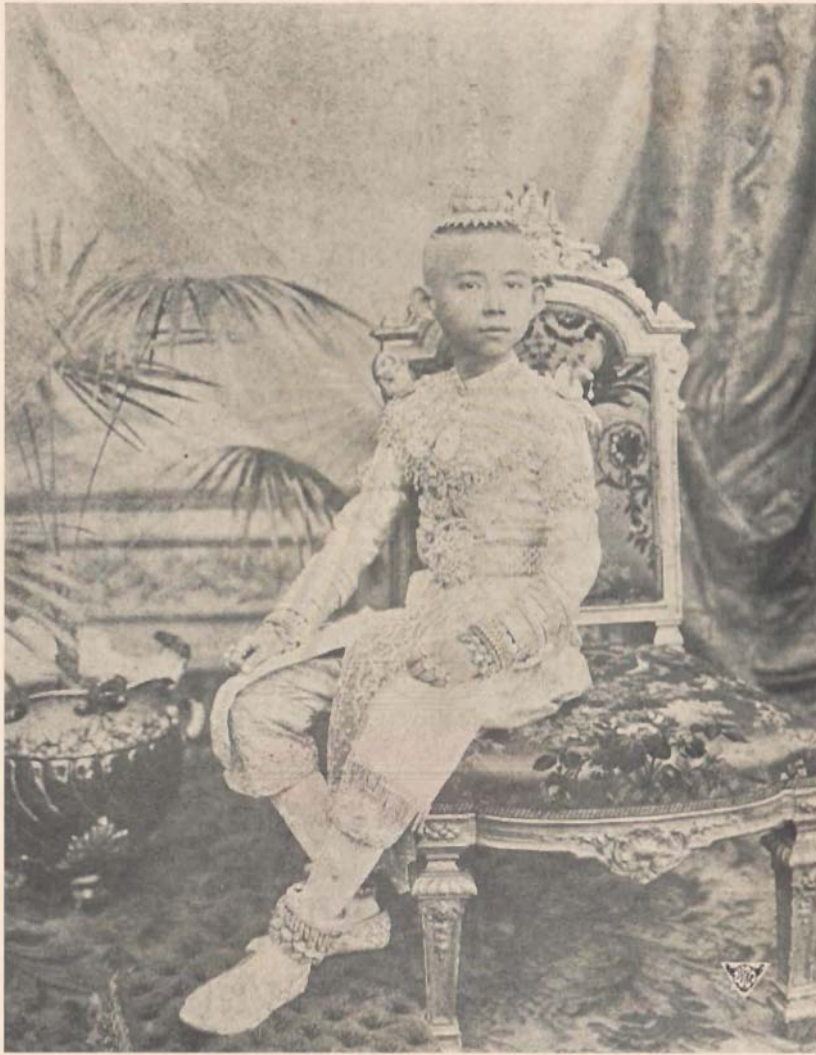
พระรูปสมเด็จพระเจ้าพ้ามืดตลอดยศ กรมขุนสงขลานครินทร์ ทรงเครื่องวันทรงฟังสวดโสกันต์ ถ่ายเมื่อปีเถาะ พ.ศ. ๒๔๔๖