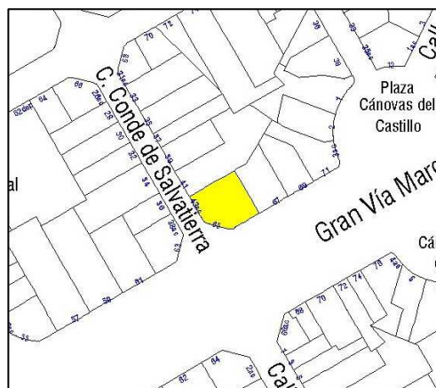
Parcelario Municipal 2009 SIGESPA

NUMERO DE EDIFICIOS: 1 NUMERO DE PLANTAS: 6 OCUPACION: TOTAL CONSERVACION: BUENO