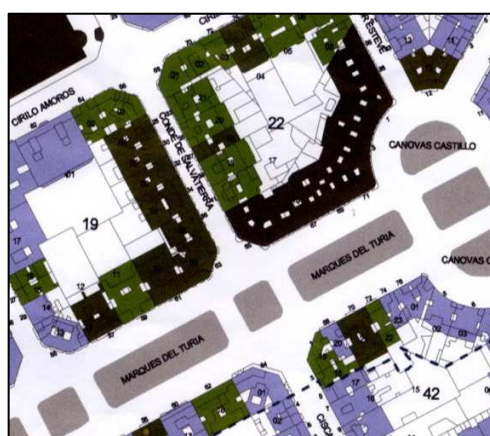
PEP-1 Ensanche Pla Remei – Russafa Nord

PLANEAMIENTO: PEP-1 Ensanche Pla Remei – Russafa Nord (BOP 26.02.2005) HOJA PLAN GENERAL: 35 CLASE DE SUELO: SU CALIFICACION: Ensanche Protegido (ENS-2L) USO: PROTECCION ANTERIOR: BRL (26.02.05) OTROS: N° Archivo PE 1653