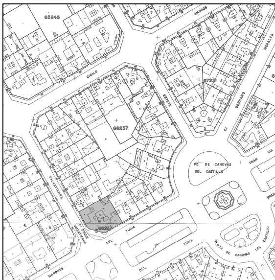
Cartográfico C.G.C.C.T. 1980