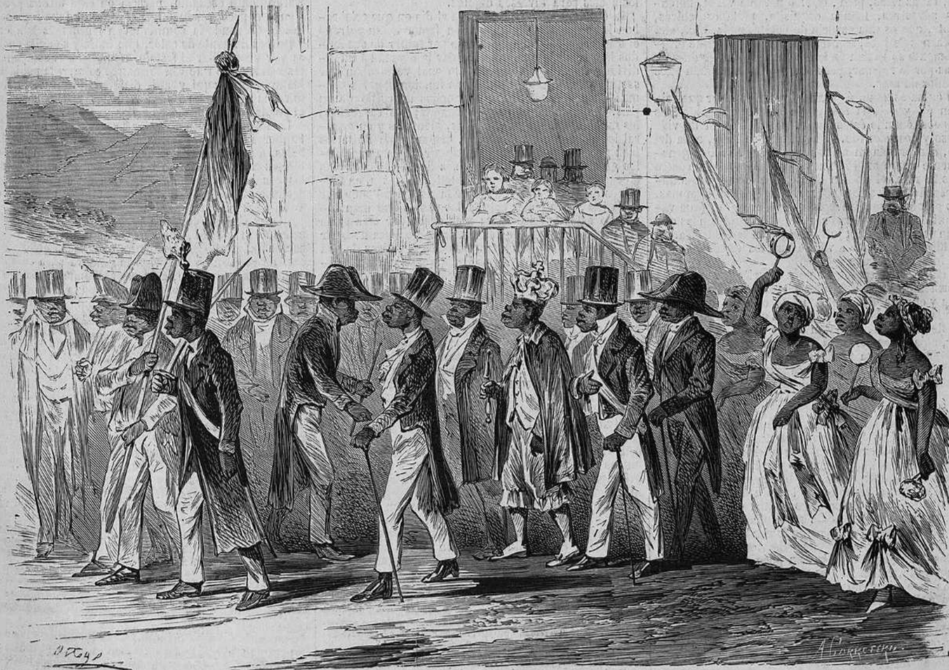
LA FIESTA DEL REY CONGO QUE SE CELEBRA EN SANTIAGO DE CUBA EL DIA DE REYES.—DIBUJO HECHO Y REMITIDO POR DON ALFONSO CALDERON ROCA.