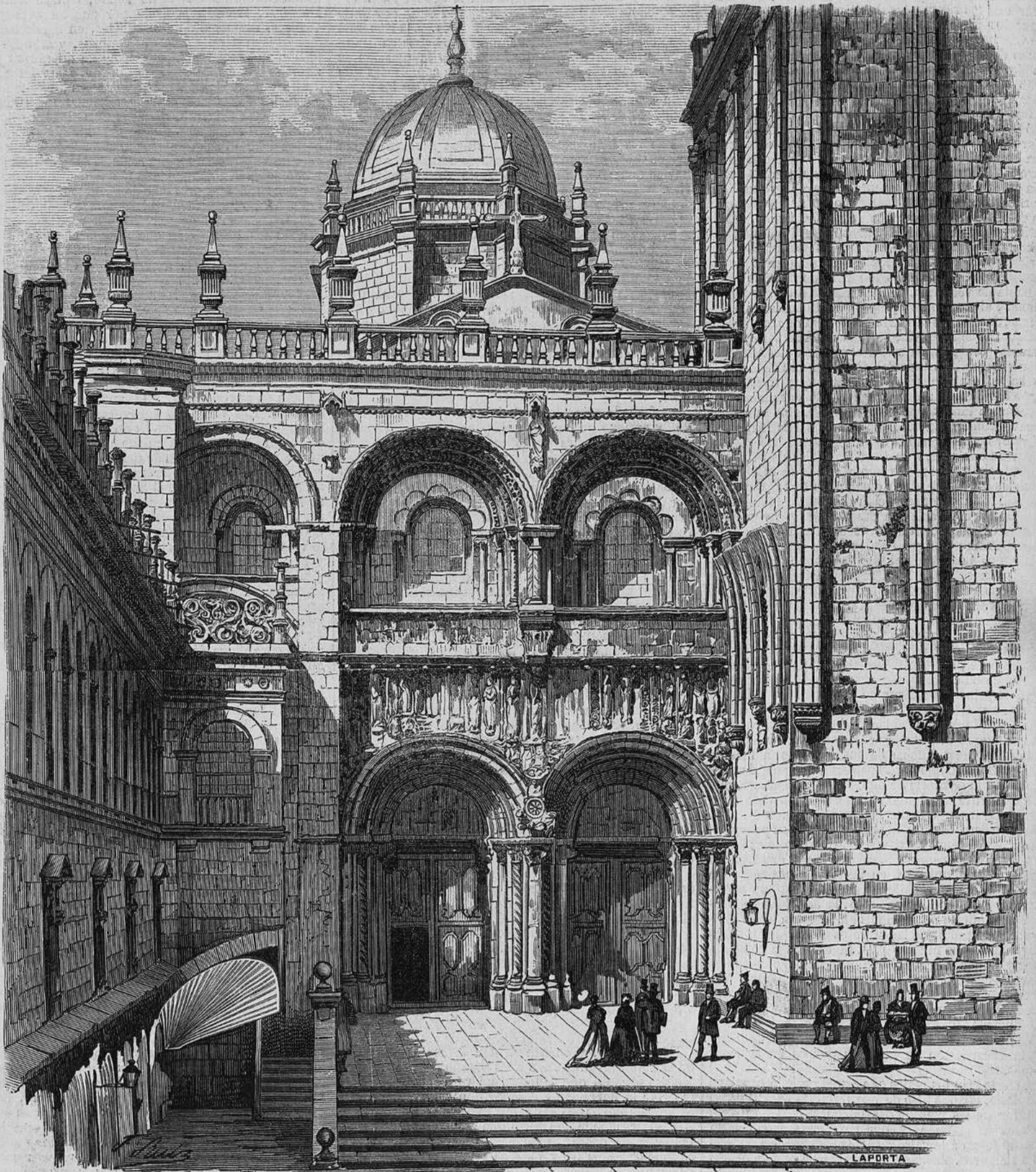
ESPAÑA.—CATEDRAL DE SANTIAGO.—FACHADA LLAMADA DE LA PLATERÍA.

labores de mano con madera, bejuco, nipa, paja fina, piña, etc., y porque la mayor parte de los mismos cosen, lavan y planchan perfectamente, construyendo además objetos preciosos y de infinita paciencia. Las bordadoras indias son incomparables por su esquisito y delicado gusto en confeccionar las obras, en concluir las y en ejecutar bien los dificultosos y lindos calados. La india, comunmente hablando, es de regular estatura; muy morena, por el sol que la abrasa; de ojos rasgados y negros; cejas idem muy pobladas; pelo crecido y hermoso, también negro; nariz chata; labios bastante pronunciados, y cara redonda. Sus pies, descubiertos y colocados dentro de unas ligeras chinelas, muestran el mismo color tostado que su semblante. Visten saya corta de colores, refajo ó tapis sobre la