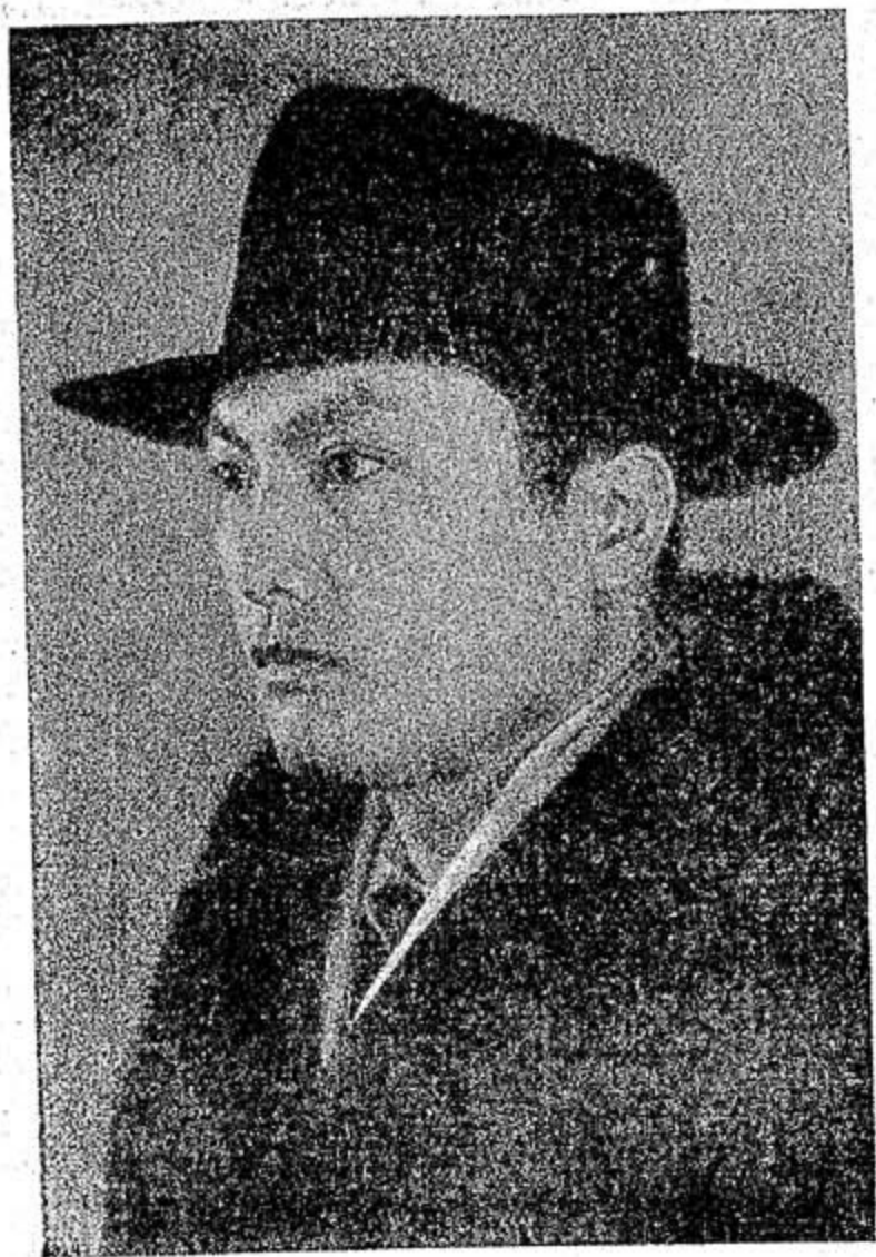
兼任 一九三五年春在 東京帝國大學