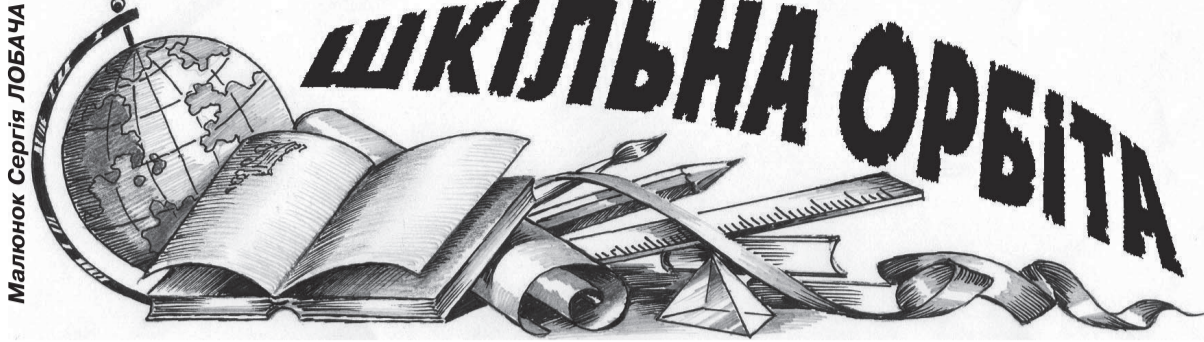
Малюнок Сергія ЛОБАЧА