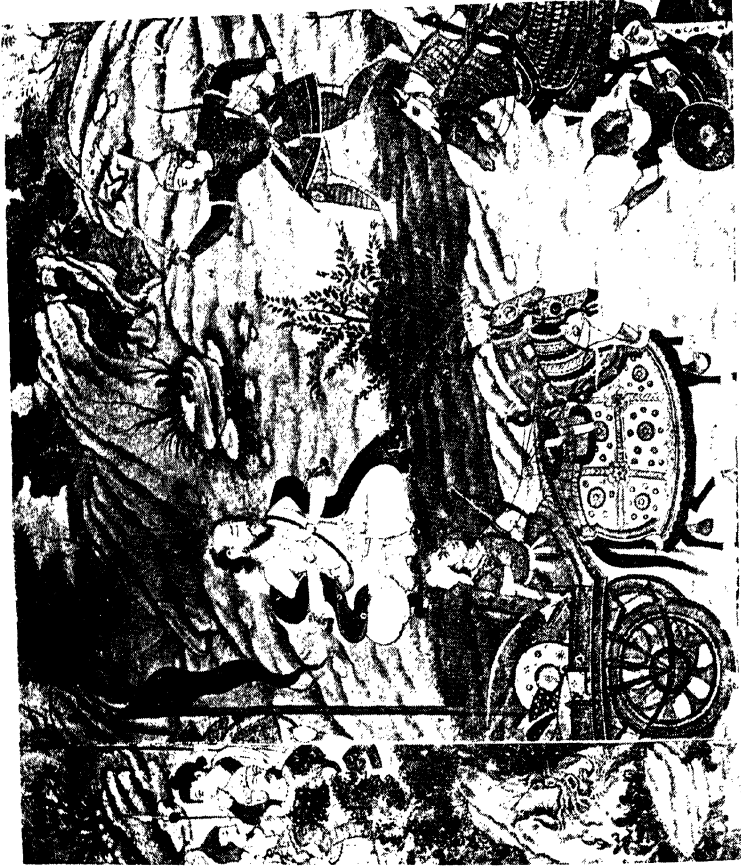
“महानगरं नो एकदमं द्रोणाग्रं श्रावणम्।” ( पृष्ठ ७३० )