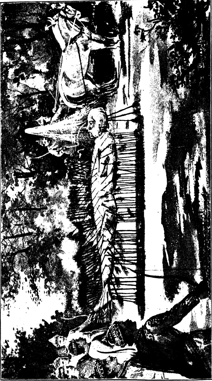
भूपोपधानदान (पृ. २९०)