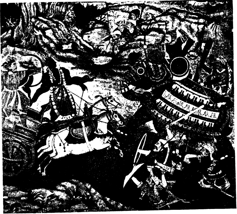
“भगदत्तार्जुन युद्ध.” (पृष्ठ ३६४.)