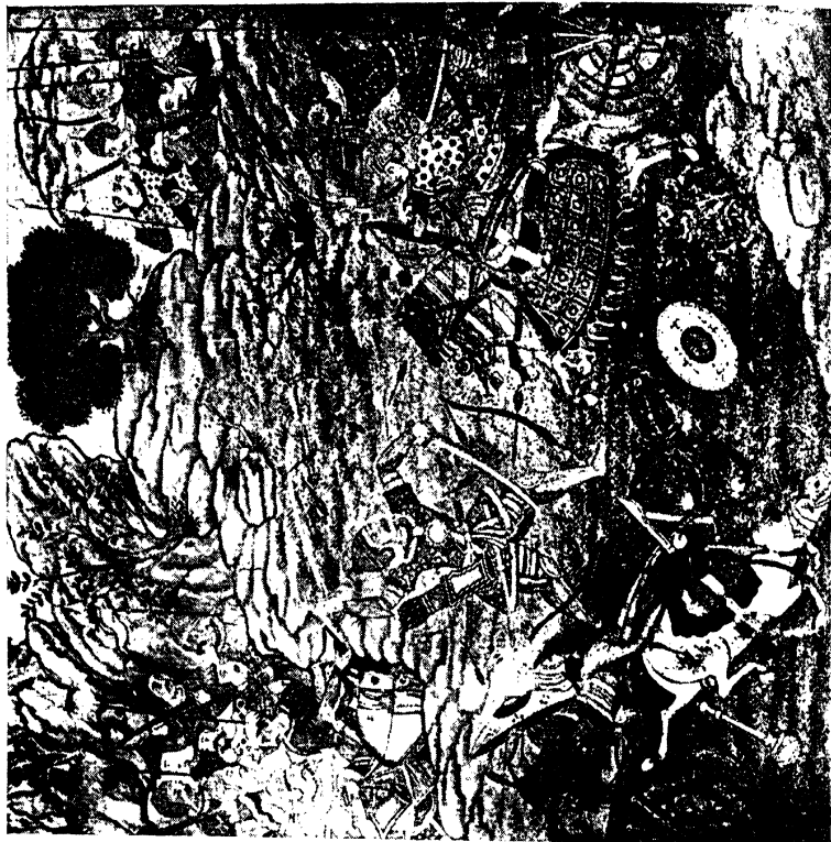
अधिमन्त्रविश्वकर्माण ( पृष्ठ ३९९. )