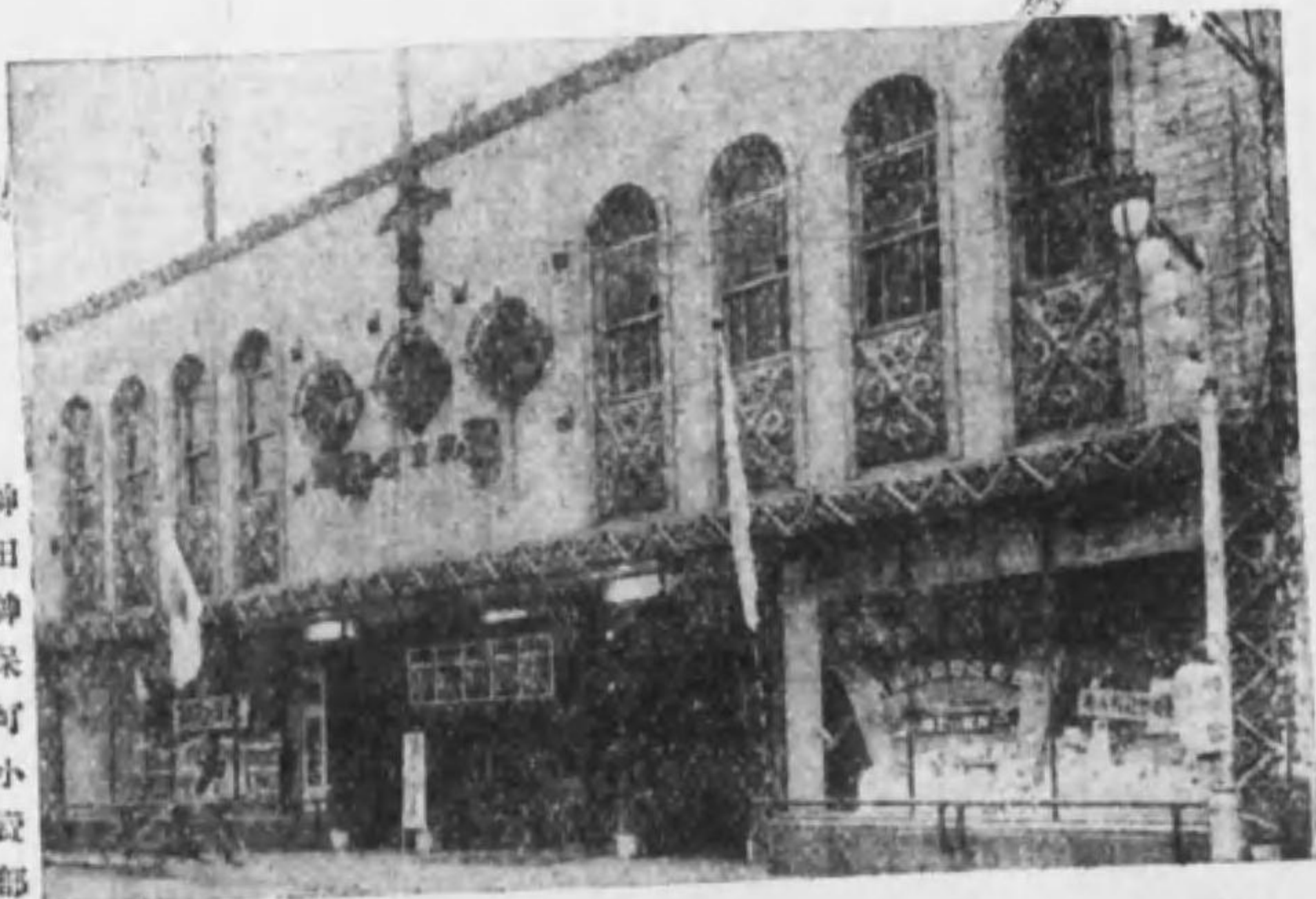
神田神保町小賣部