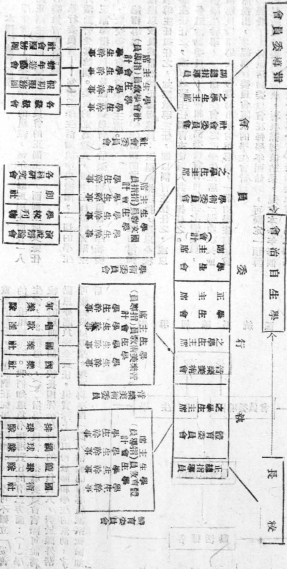
圖 統 系 政 行 動 活

現可根據上述的組織原則及其具體步驟，來草擬一行政集中和統一的具體方案，以備一般中學的參考。