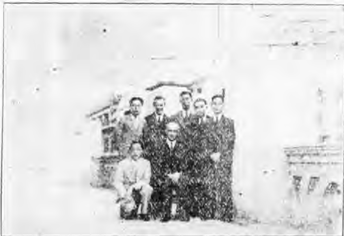
影合友校與港香在長務友

一 我之近況：我現仍舊坐在屋子裏「研究」。但常常想燕京和北平。最近的將來，要到蘇格蘭東部去研究海岸線等調查海岸植物。我本不能讀法文。但是每天拿看法文字典讀關於地質的法文書籍，其慢可知。除此之外，常常想回國。中國應當把那些賣國的逐出洋。