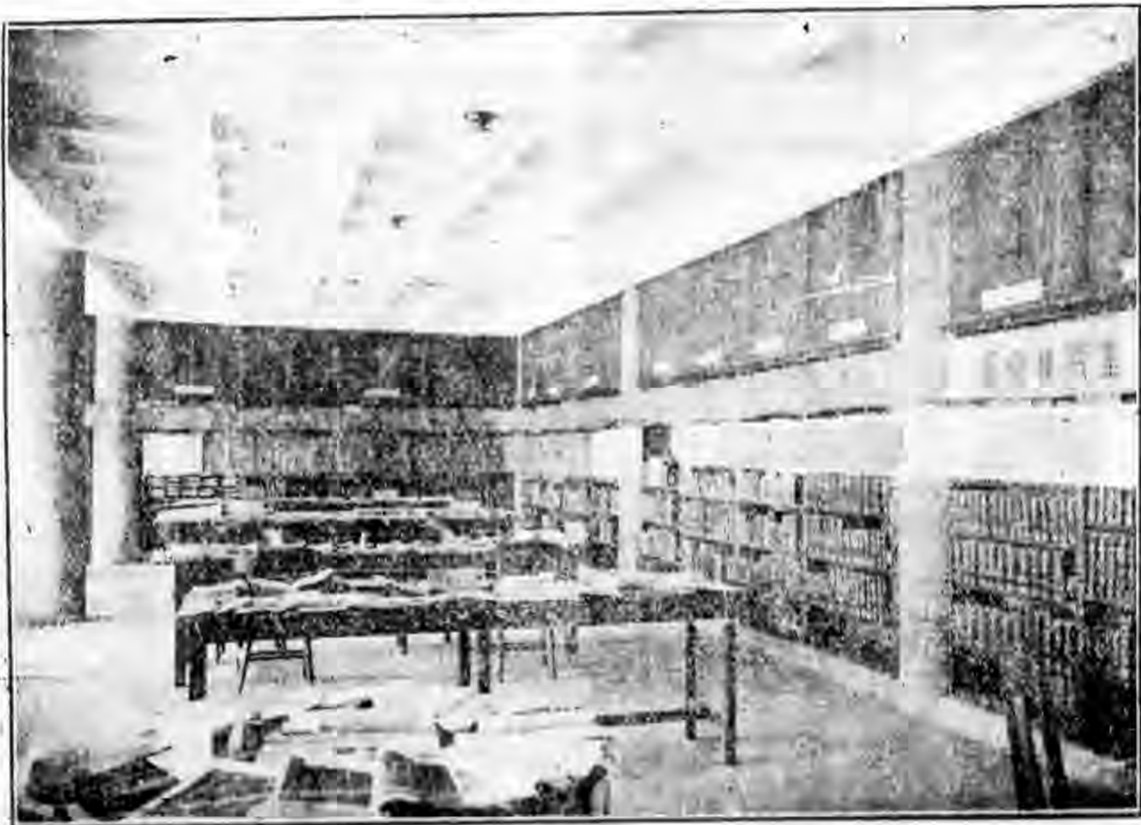
校友圖書館展覽留影