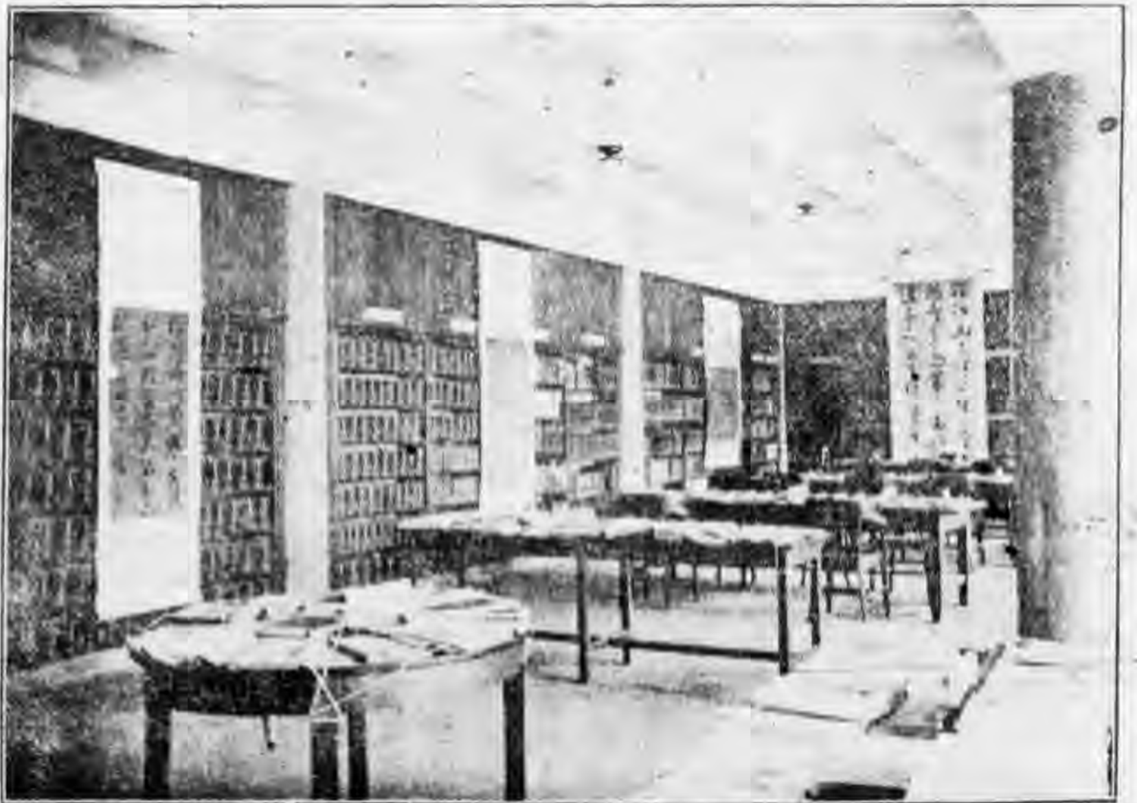
二 影 留 覽 展 館 書 圖 節 友 校