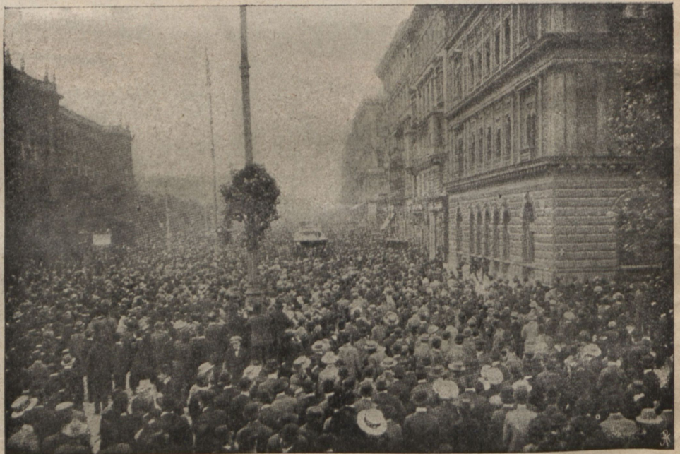
Демонстрація въ Вѣнѣ по случаю дороговизны жизни.