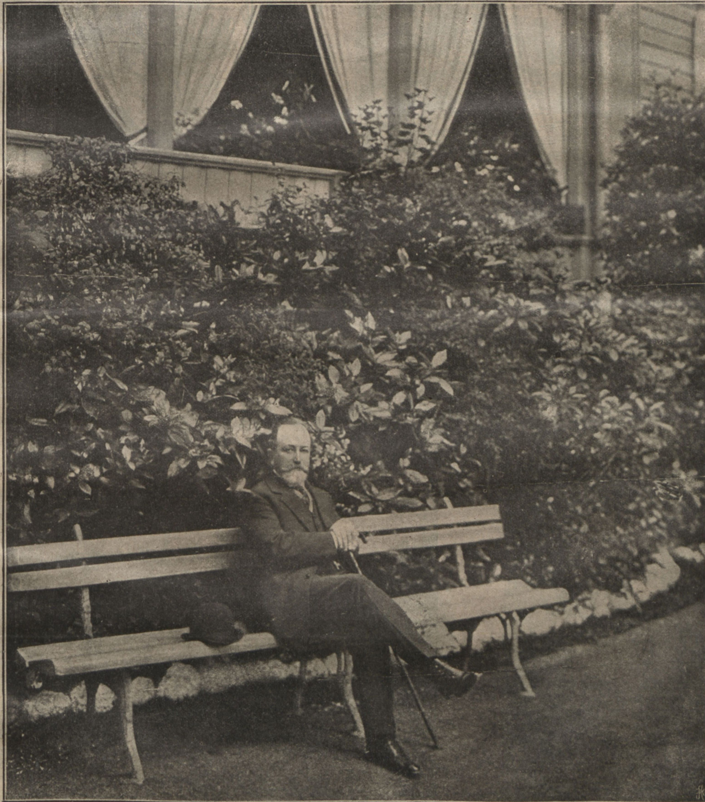
Новый председатель совѣта министровъ В. Н. Коковцовъ.