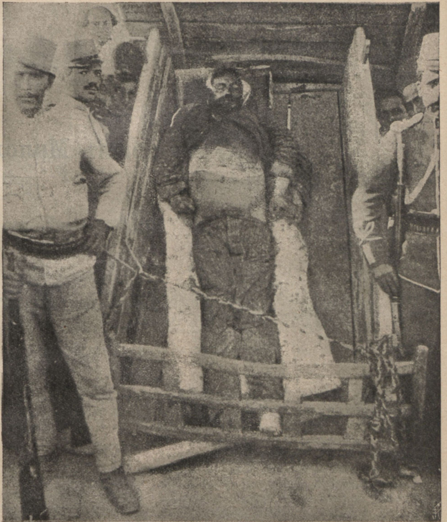
Трупъ разстрѣляннаго Сардаръ Аршада, выставленный на показъ на тегеранской площади.