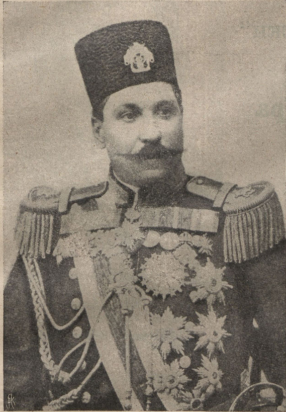
Сторонникъ эксъ-шаха Сардаръ-Аршадъ.