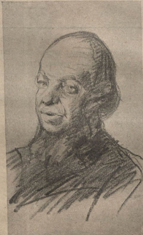
Землевладѣлецъ и депутатъ—Богдачовскій.