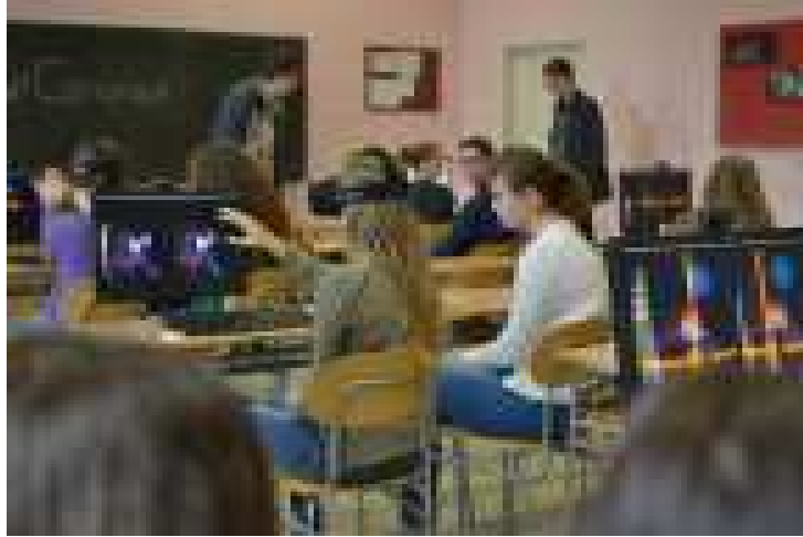
नवे शिक्षण, नवे शिक्षक/१५५

नव्या माहिती, तंत्रज्ञान, संगणक, इंटरनेटमुळे तर आपले वर्तमान शिक्षणच कालबाह्य ठरवलं असल्याने शिक्षकास नवनवी साधने वापरण्याचे कौशल्य अवगत करणे अनिवार्य झाले आहे. एके काळी स्टेथॅस्कोप वापरणारा डॉक्टर मोड्यु मानला जायचा. आता एका डॉक्टरकडे एका रोगाची, अवयव उपचाराची, सर्व साधने जमा करणे अवघड होऊन बसले आहे. तीच गोष्ट शिक्षकांची झाली आहे. भूगोल शिक्षकाला एके काळी पृथ्वीचा गोल हाती असला की, ब्रह्मांड शिकवण्याचे सामर्थ्य यायचे. आता शाळेत वेधशाळा, तारांगण, अवकाशवेध घेणारी दुर्बीण, जीपीएस सारे हवे. पूर्वी भाषा शिक्षकाला बोलता, गाता, नाचता आले की, पुरेसे व्हायचे. आता त्याला कॅसेट, सीडी, रेकॉर्ड्स, एम. पी. श्री. फिल्म म्युझिक सिस्टिम, कॉम्प्युटर लॅब, लॅपटॉप, लॅंग्वेजलॅब, इंटरनेट, लेसर प्रोटेक्टर, थिएटर, थ्रीडी शो, सारं जग लागते. हे कमी, अधिक प्रमाणात साऱ्याच विषयांचे झाले असल्यामुळे शिक्षकाची स्थिती ऑर्केस्ट्रा कंपोजिटरसारखी झाली आहे. त्याला सारी वाद्ये, सूर, ताल एकासुरात गोवता यावे लागतात तसे शिक्षकास आपला विषय सर्व ज्ञान-विज्ञानाच्या संदर्भात (आंतरशाखीय - Inter Disciplinary) शिकवता येणं अपेक्षित असल्याने नव्या तंत्रज्ञानाने निर्माण केलेली नवी साधने वापरण्याचे त्याला ज्ञान व कौशल्य दोन्ही आवश्यक आहे.