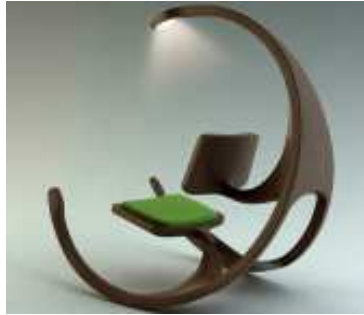
नवे शिक्षण, नवे शिक्षक/१६२