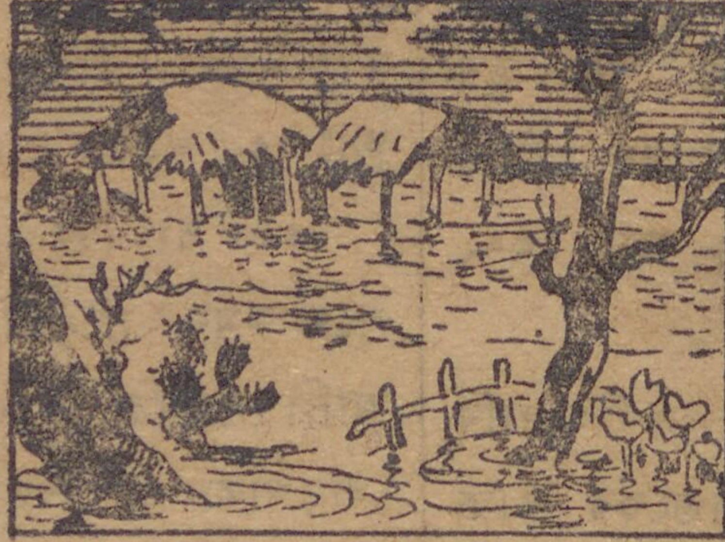
সোনাৰপুৰ আৰাণীচ পৰিকল্পনা

যে পতিত জলাভূমি একদিন ছিল ম্যালেরিয়াৰ আত্মনা, সেখানে আজ সোনালি ধানের ঢেউ ব'য়ে যায়, সে-জায়গাৰ দৃশ্য আজ অতি মনোৰম।