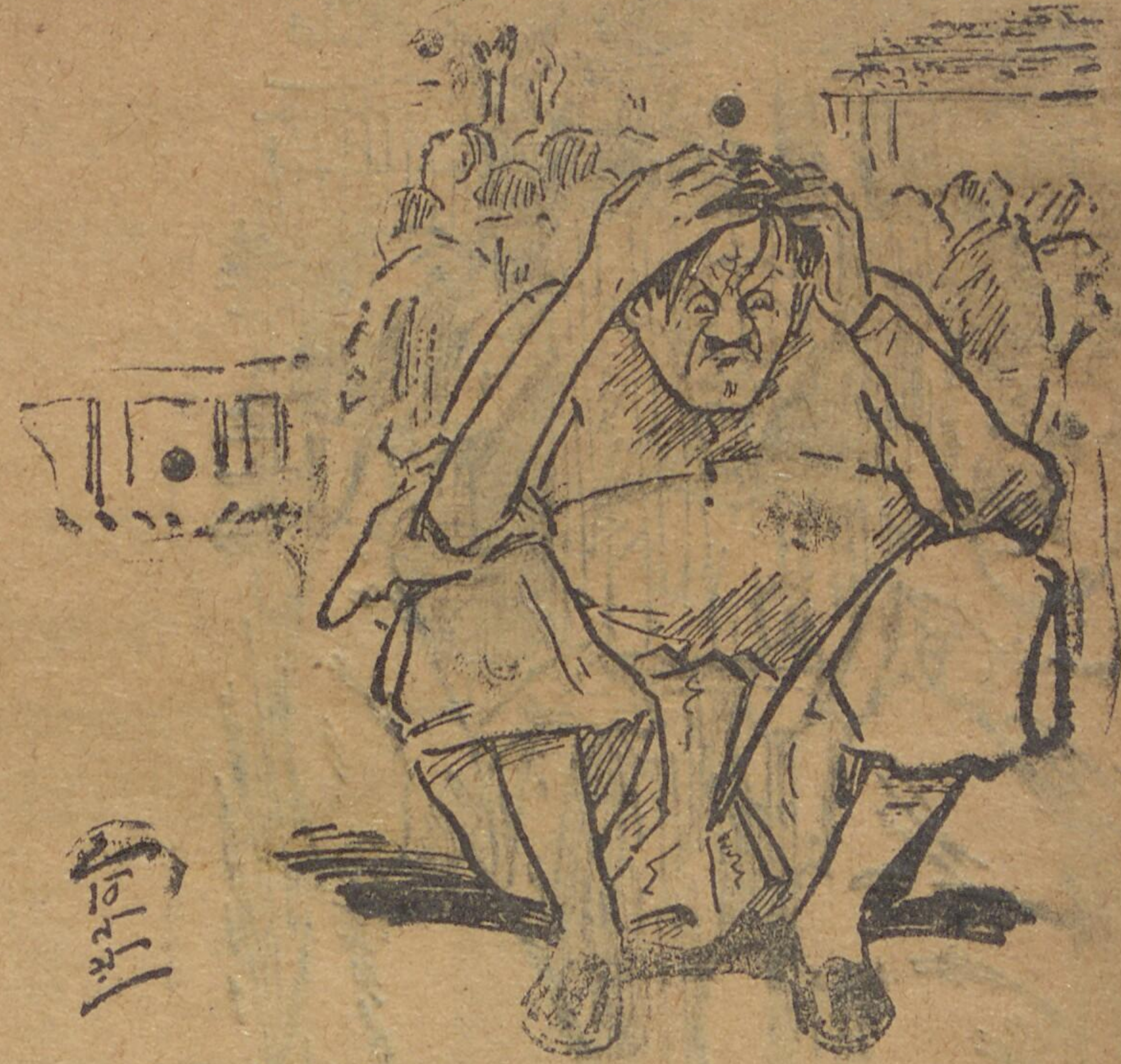
আর একটা মরলে কাষ্টিং এ দেখা যেতো। দুটো মরলে "সিগুৰ"