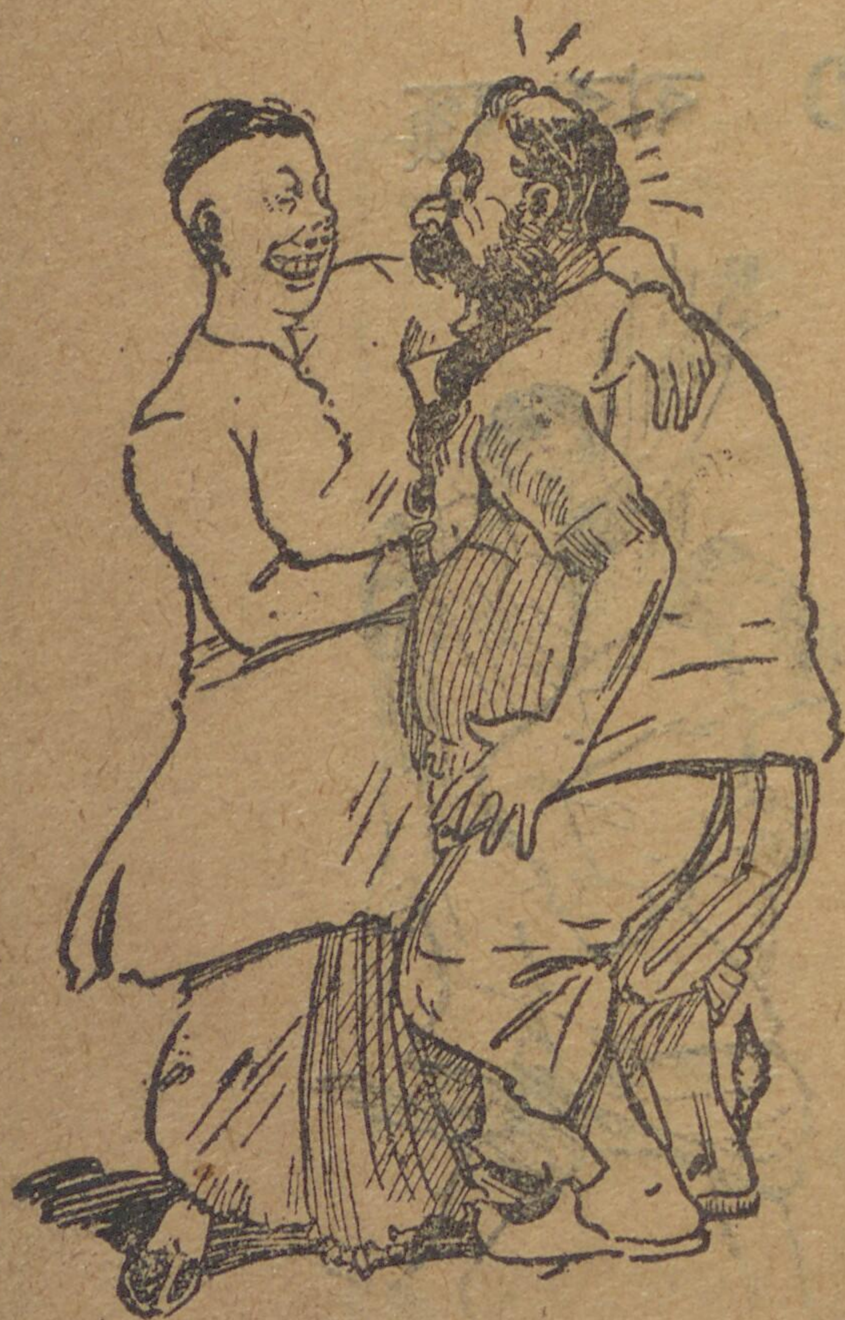
সেয়ানে সেয়ানে কোলাকুলি