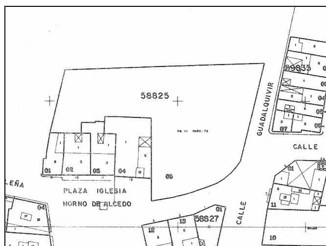
Cartográfico C.G.C.C.T 1980