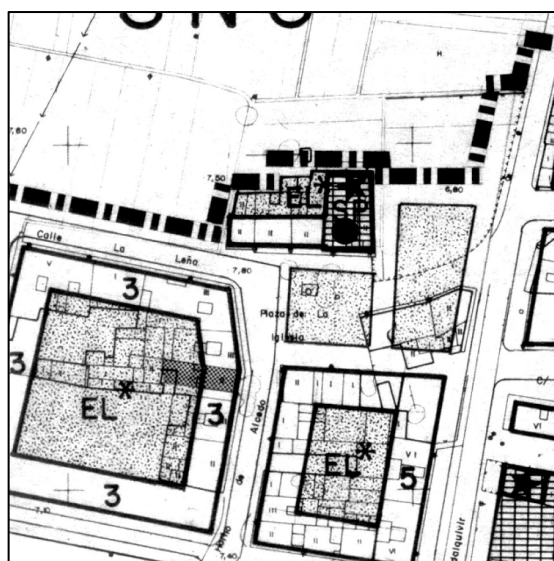
Plan General de Ordenación Urbana 1988

PLANEAMIENTO: PGOU (BOE 14/01/1989) HOJA PLAN GENERAL: 61 CLASE DE SUELO: SU CALIFICACION: UFA-1 (Vivienda Unifamiliar 1- Casas de Poble) USO: SP (Servicio Público) PROTECCION ANTERIOR: 2º OTROS: Corrección de Errores: DOGV 03.05.1993