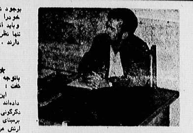
ناهما یکم نژاد، جانشین فرمانده نیروی دریایی جمهوری اسلامی ایران

در پی پیروزیهای حاصله در حمله آرمین جابباری فرمان نیروی دریایی ایران که به مساعی این نظامی دریایی با نیروهای متنی بر سر پهلو آبهای نیلگون خلیج فارس با چالشیهای خود حماسه های جزیره ای ایران را زینت بخشید و رفاهت خلق کرد. بدین تسلیح تسکین نفسی و انگیزه و آگاهی مردم این نواحی را فراهم کرد.