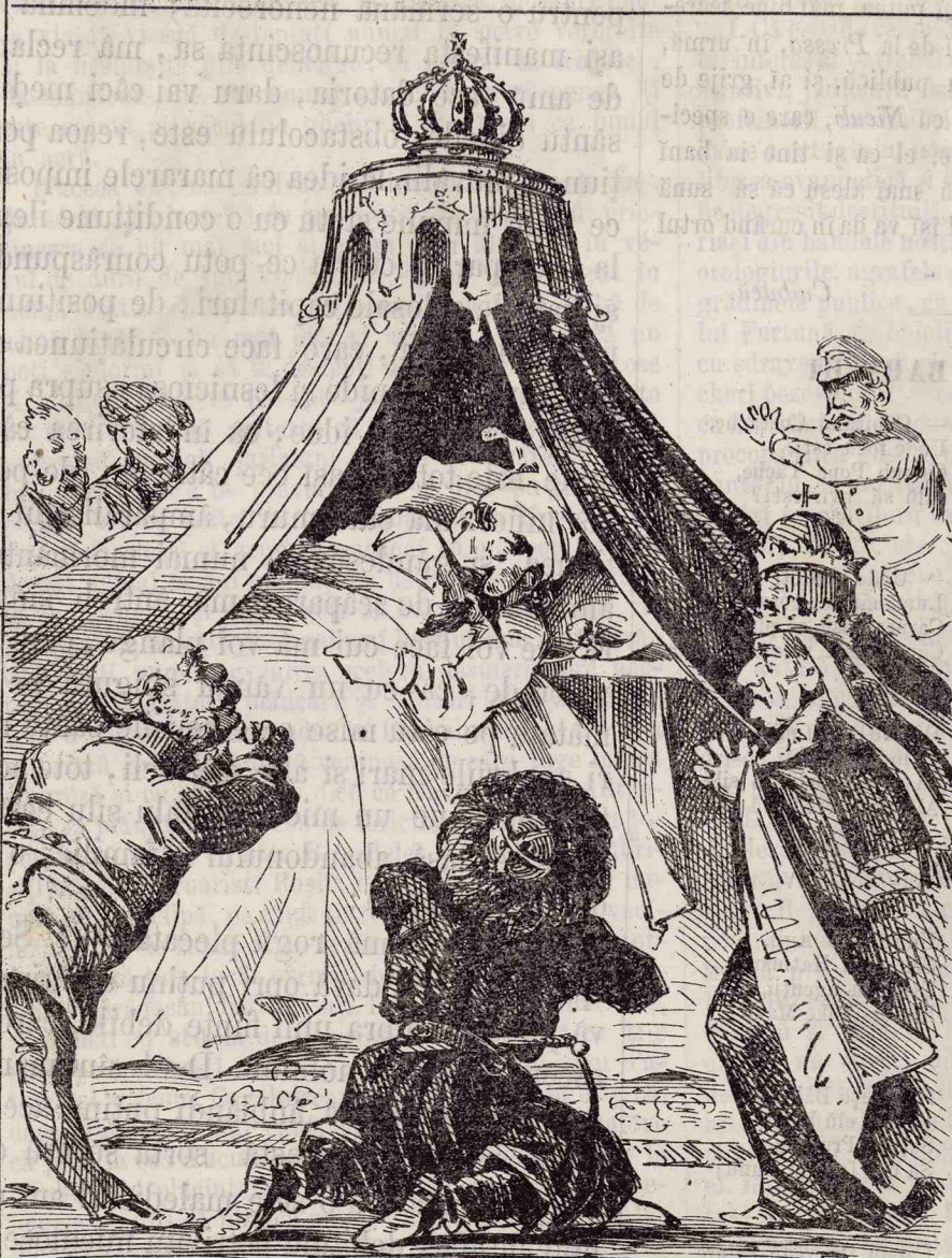
Tină-țer Domnezeu sănătosu.