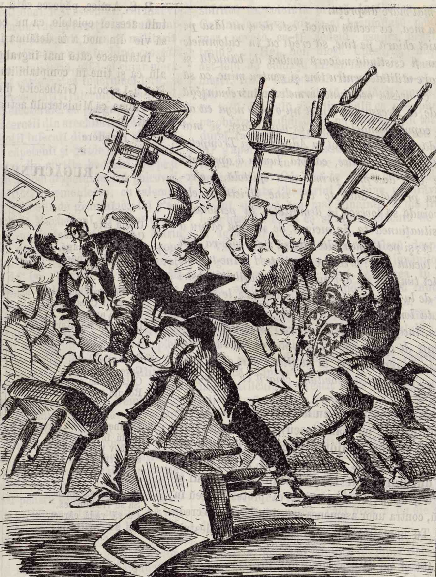
Cea mai completă armonie domnește în Ministerul actual!!!!