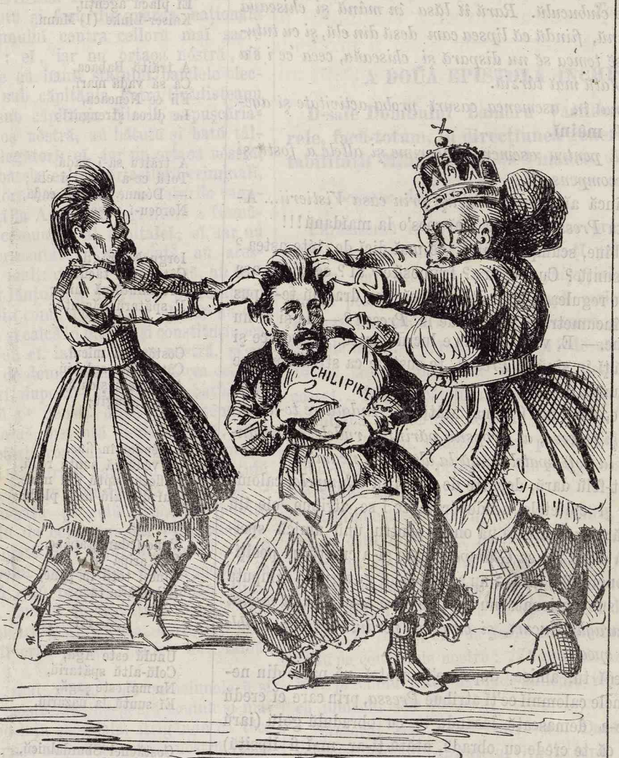
Ne ai îngelatū mișelule, tu ai furatū totū și nouă nu vrei sâne lăși nimicū.