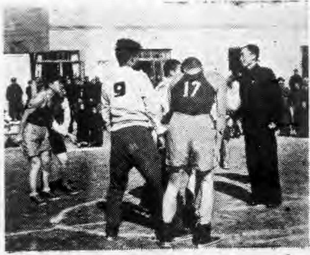
右圖為徐縣長為青年杯賽開球留影 (着中山裝者——徐縣長)