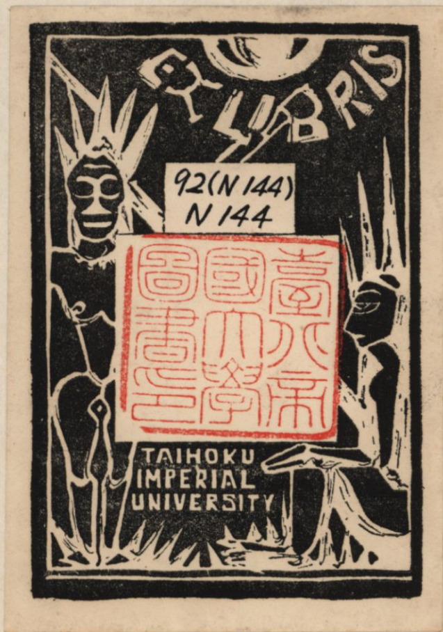
國立臺灣大學圖書館典藏 由國家圖書館數位化