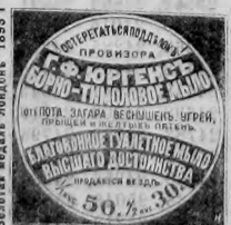
Зелотая медаль Ломбардъ 1883

Въ Управленіи Сѣверныхъ жел. дор. 27 ноября сего года въ 12 часовъ дня конкуренція поставы шпалъ широкослѣдныхъ 312 000 и узкослѣдныхъ 300.000 штукъ и 343 кшпалета первоначальныхъ брусковъ по заочтаннымъ объявленіямъ. Подробнѣе лично и почтой (Москва, Мясницкая, домъ Стригановскаго учебнаго. Материальныя (суджи) отъ 10 до 4 часовъ дня. 3—2