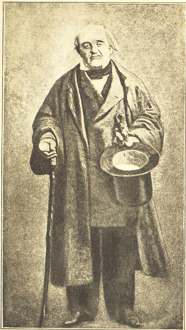
Михаилъ Семеновичъ Щепкинъ.