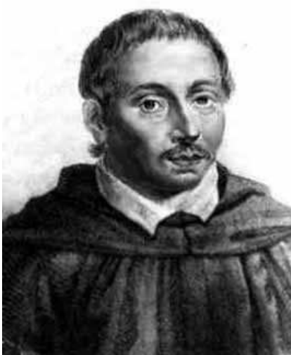
Bonaventura Cavalieri (1598-1647)

Es seien (M, \mathcal{A}, \mu) und (N, \mathcal{B}, \nu) zwei \sigma -endliche Maßräume und T \subseteq M \times N eine messbare Teilmenge. Für jeden Punkt x \in M ist