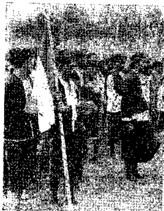
Sok aja Baduj anu darongkap ka Serang, dimana aja pepestaan Pangagung.

Dupi palungguhanana eta para Hijang teh teu tebih ti dinja, ajana di tjaket sirah walungan Tjiudjung sareng Tjisimeut (Tjiparahijang) anu wastana parantos kawentar disebut: Artja-Domas tea.