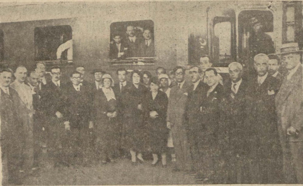
Dün sabah Dumlupınar'a hareket eden İstanbul ihtifal heyeti

Bugün Yeşilköy'de 3 yeni tayyaremize isim konma merasimi yapılacaktır