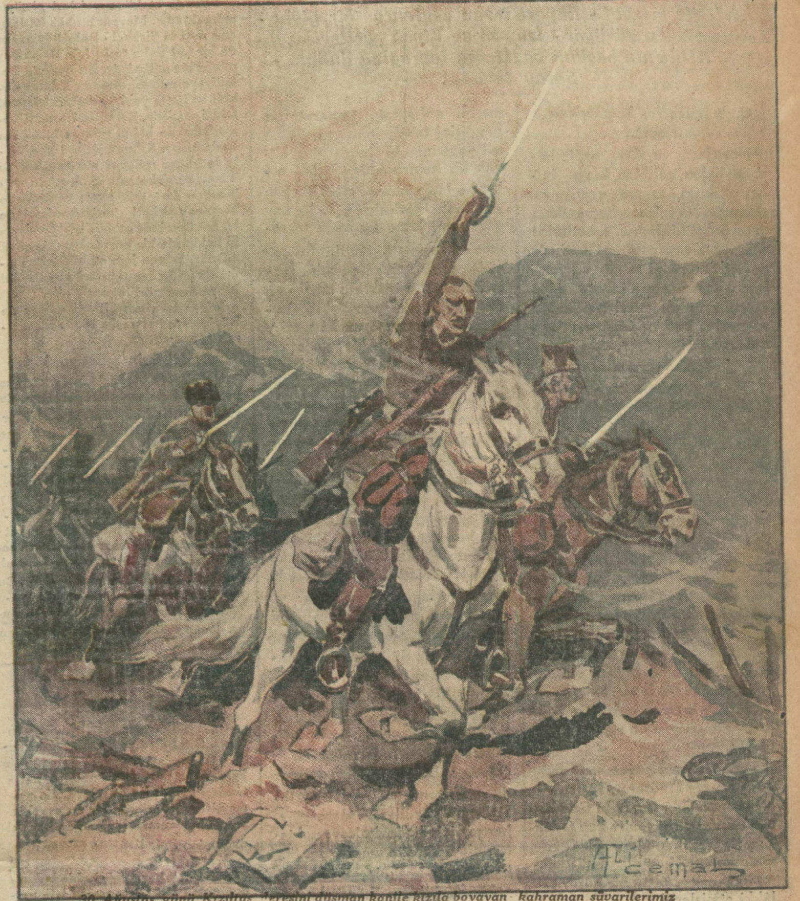
30 Ağustos günü Kızılay'ın düşman kanlıta Rızla boyayan kahraman süvarilerimiz