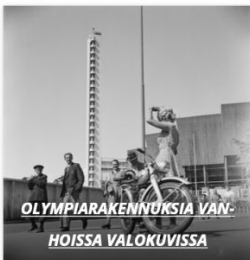
OLYMPIARAKENNUKSIA VANHOISSA VALOKUVISSA