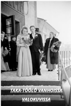
TAKA-TÖÖLÖ VANHOISSA VALOKUVISSA