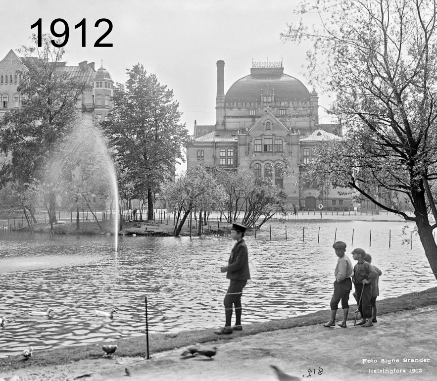
Helsingfors 1912