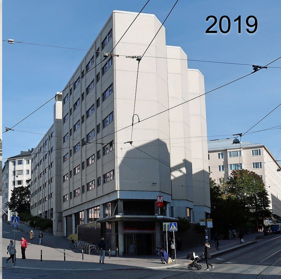
Porthaninkatu 2, 4, 6, Signe Brander / Helsingin kaupunginmuseo