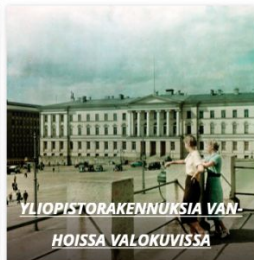
YLIOPISTORAKENNUKSIA VANHOISSA VALOKUVISSA