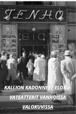
KALLION KADONNEET ELOKUVATEATTERIT VANHOISSA VALOKUVISSA