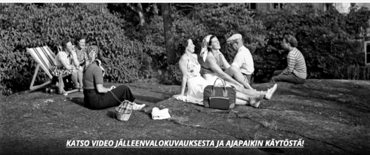
KATSO VIDEO JÄLLEENVALOKUVAUksesta JA AJAJAIKIN KÄYTTÖSTÄ!

kesäkuu 2015 huhtikuu 2015 joulukuu 2014 lokakuu 2014 syyskuu 2014