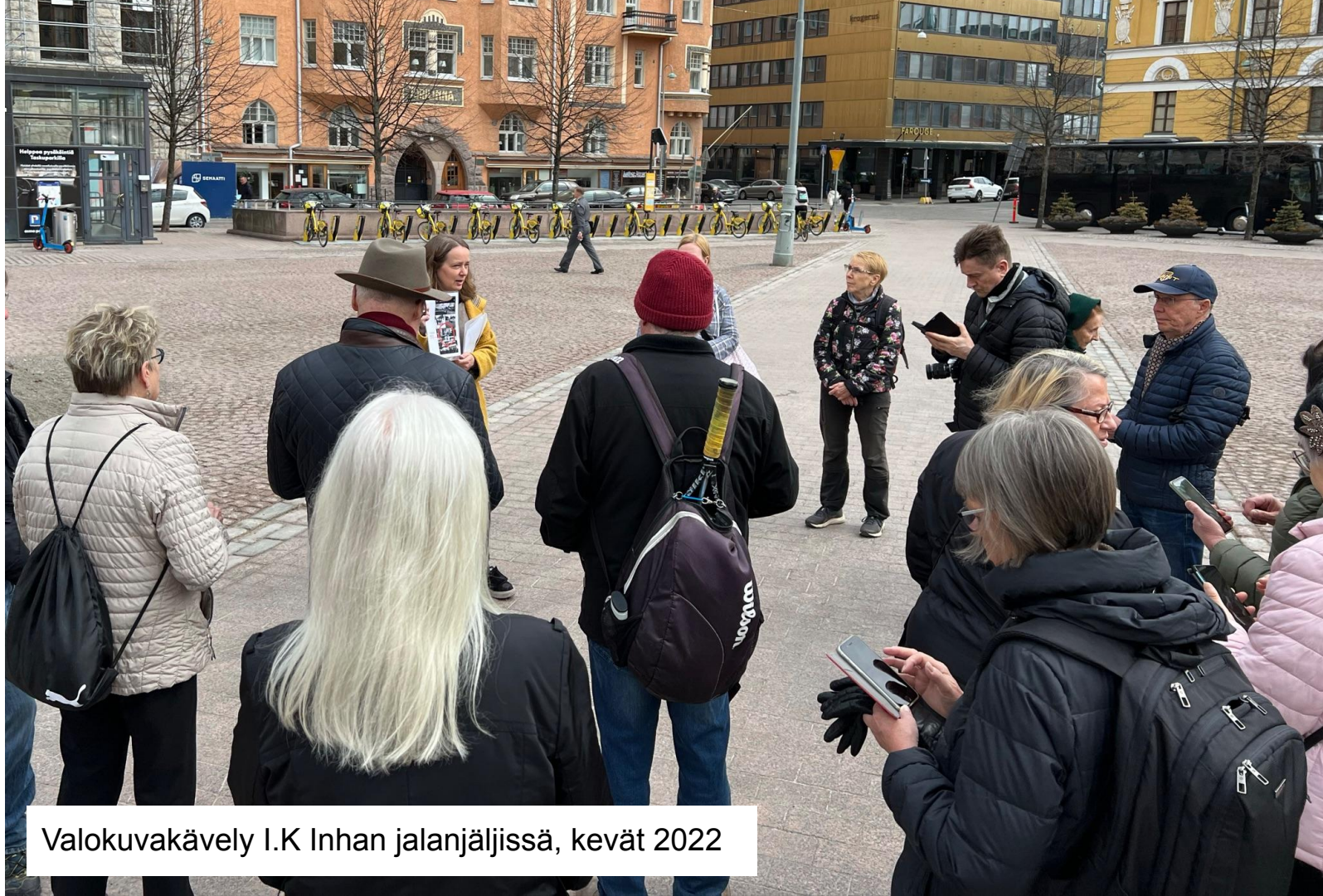
Valokuvakävely I.K Inhan jalanjäljissä, kevät 2022