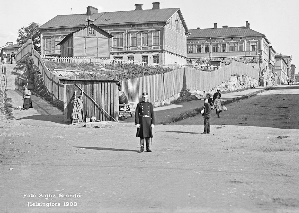
Helsingfors 1908