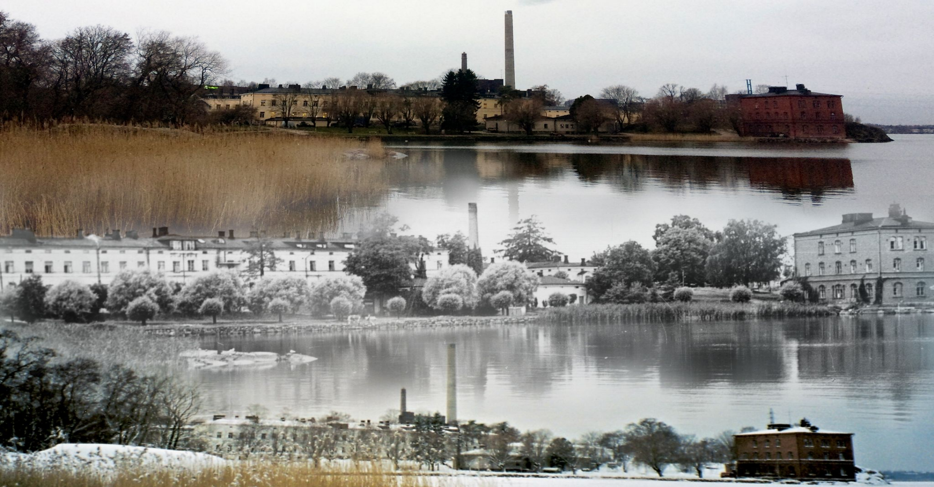
Lapinlahden sairaala. Kuvaajat Eino Heinonen, 1940 ja Anja Hatva, 2000, 2020. CC-BY-SA