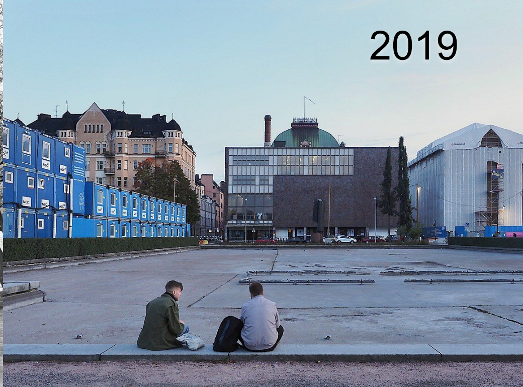
Kaisaniemen lammikko. Taustalla Kansallisteatteri