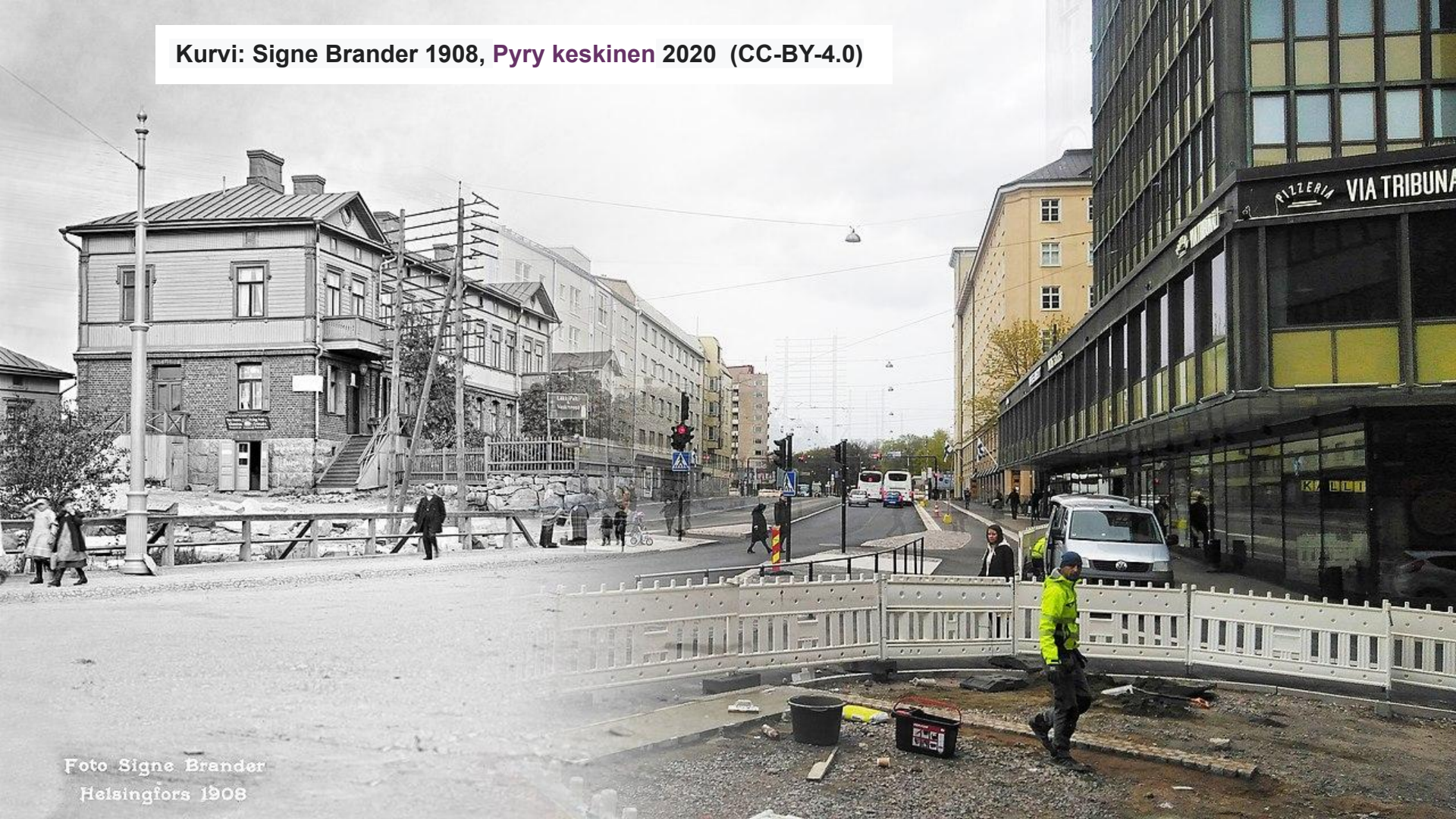
Helsingfors 1908