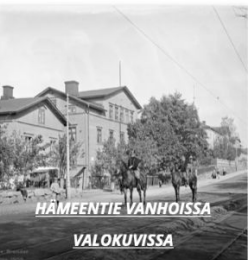
HÄMEENTIE VANHOISSA VALOKUVISSA