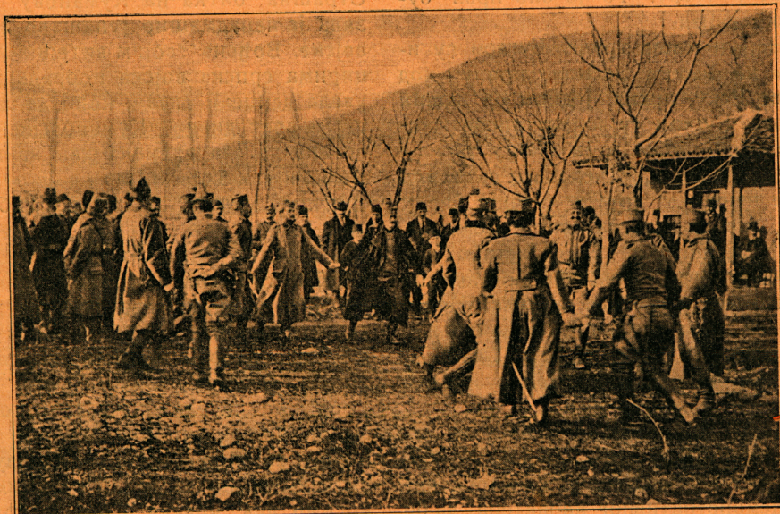
Веселе на Бадње вече у Битољу. Српски официри прослављају Бадње вече

јаним српским типовима, да су то у рату неустрашиви лавови, који су у непријатеља толики страх унели, да је безобзирце бежао, како је чуо, да српска војска долази. Али им ето ни ово одмориште не би дуга века. Сада се по ново латише убојног оружја, да из ослобођених крајева отерају другу напаст — Бугаре, који им силом хтедоше узети ове покрајине, које су Срби крвљу освојили. Насртљивост бугарска до сад је мушки од храбрих српских јунака сузбијена, добро се проведоше ти отимачи, јер српски им соколи добро очерупаше перје, те главом безобзирце беже и моле, да их поштеде. И овом се приликом обистинило оно: „да се не боји свака шуша Бога, него батина“, а те су халапљиве Бугаре сада освестили, од прекомерне надутости и халапљивости. Славан је Србин, јунак је сваки да му пара нема!