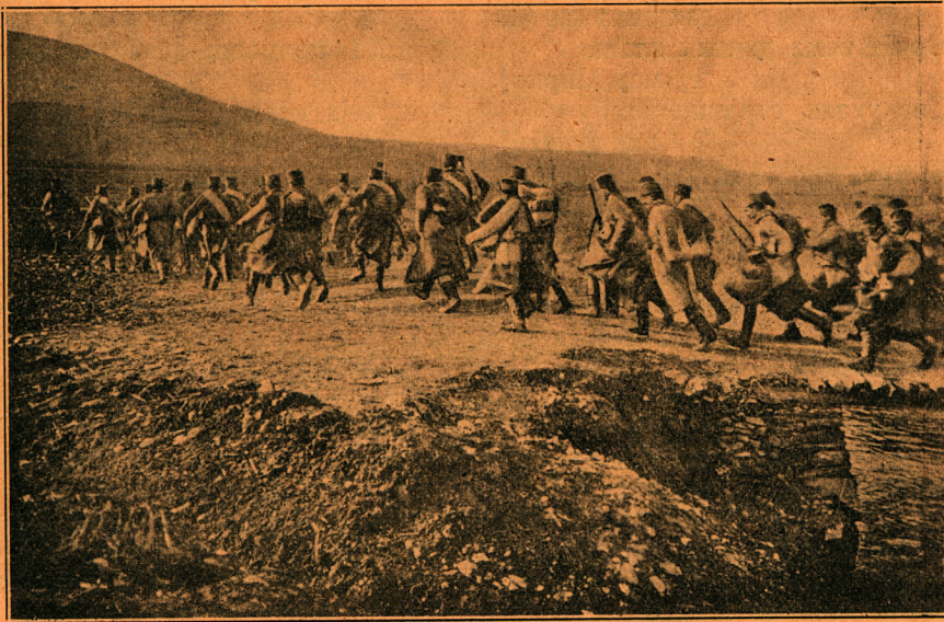
Победна српска војска са Куманова гони непријатеља