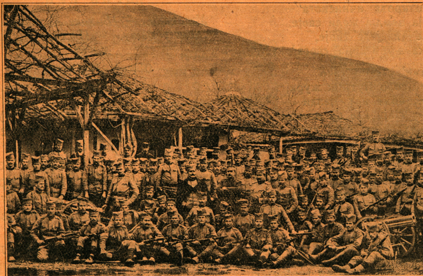
Српска војска у Тетову

ша ти у носу. Боље да Ранђи доведеш каквог Турчина.