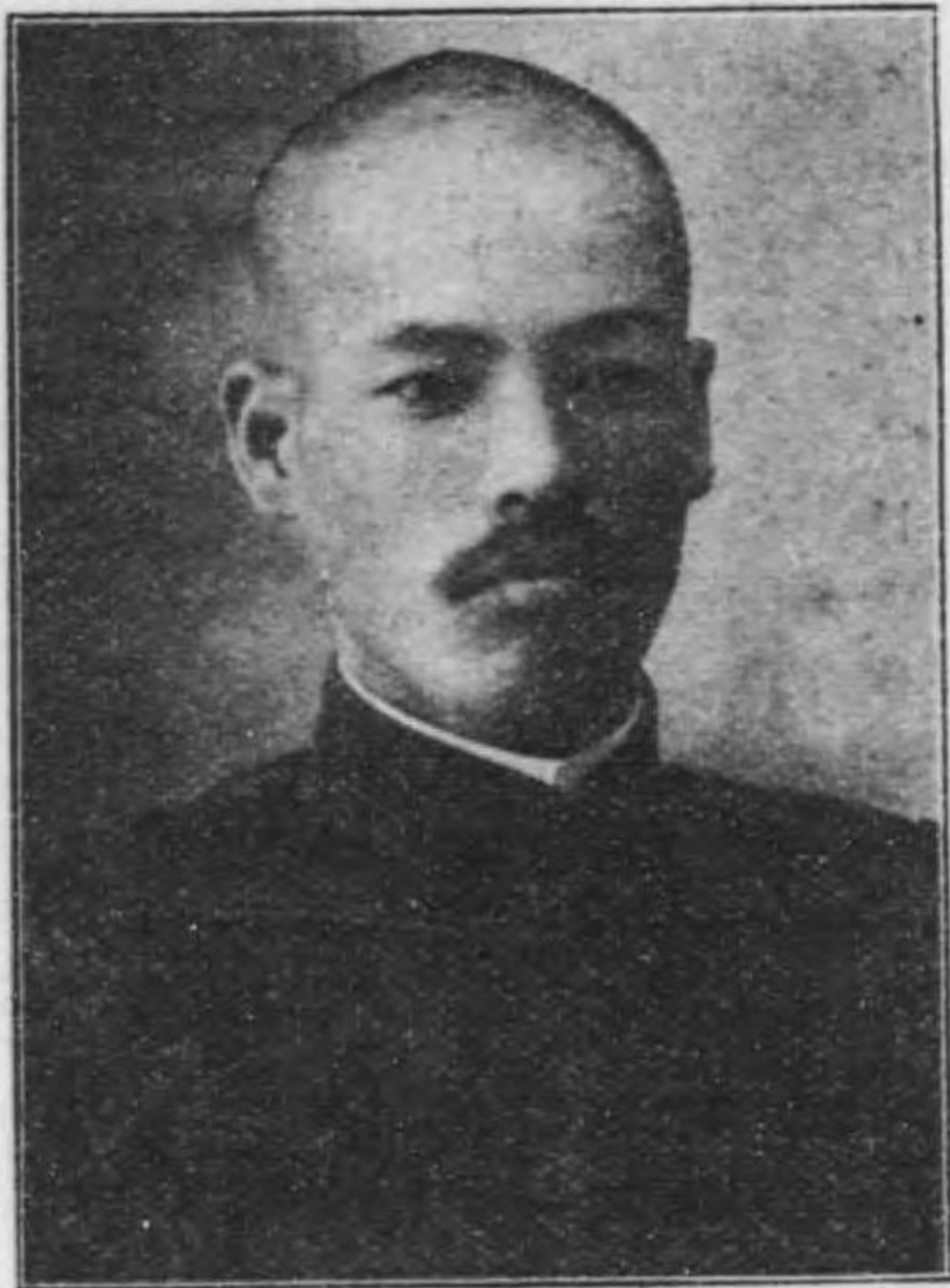
毎ニ言動壯烈大ニ士氣ヲ鼓舞シタリ

十月沙河會戰ノ數日前中尉ハ大隊副官代理ヲ罷メテ原中隊ニ復歸センコトヲ請ヒ遂ニ許サル同月十日ヨリ十五日ニ至ル間臨時中隊長代理ト爲リテ三塊石山ノ夜襲ニ參加シ續テ雙臺子、孤家子、紅葉山ニ轉戰シ十四日團山寺高地ノ攻撃ニ於テ