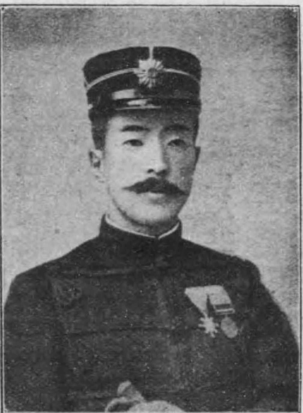
死後一族に希望する事

隙ニ沿ウテ敵壘ニ逼ル敵兵之ヲ覺リ銃砲亂射探照燈光彈ヲ以テ進路ヲ照シ爆藥ヲ擲チテ應戰ス我兵屈セズ吶喊シテ邁進セシガ死傷相踵ギ積屍累々タリ少尉ノ部下繼進スル者僅ニ兩三名少尉亦腹部ニ一彈ヲ受ケテ倒レ從卒負ウテ退ク少尉之ヲ斥ケテ曰ク「汝余ヲ棄テ、速ニ往キテ彼山ヲ取レ」ト遂ニ擔架ニ載セテ搬送セラレ其途中ニ於テ暎シタリキ