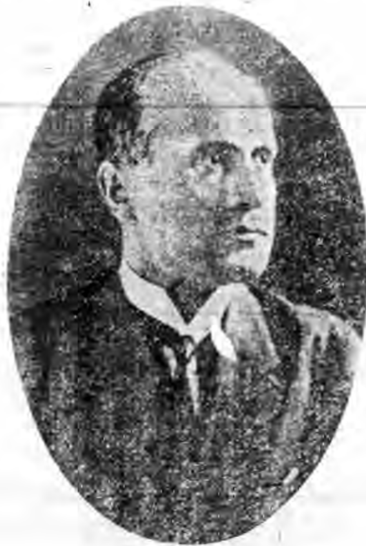
慕 索 里 尼