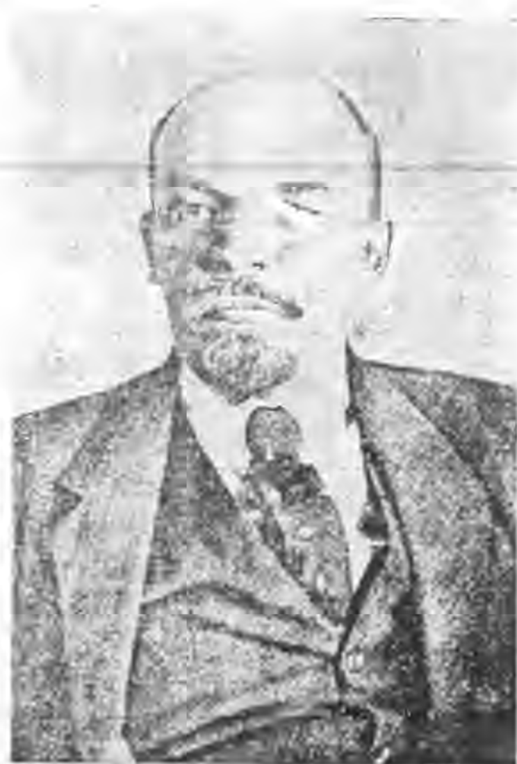
列 寧 遺 像